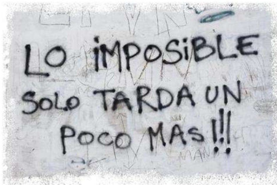
Photo 8 : « L'impossible tarde seulement un peu plus !!! », graffiti quelque part en Amérique dite latine... ( http://blog.panamajack.es/es/2011/11/07/the-impossible-just-takes-a-little-longer/ )

« Aysén Réserve de Vie » n'est sans doute pas une nouvelle utopie en Patagonie. Elle n'est pas celle d'un retour à l'état sauvage, ni celle d'une mise en réserve, ni encore véritablement la terre fertile d'une « nouvelle économie » pour philanthropes verts. Elle est seulement, mais c'est déjà beaucoup, un certain état d'esprit.