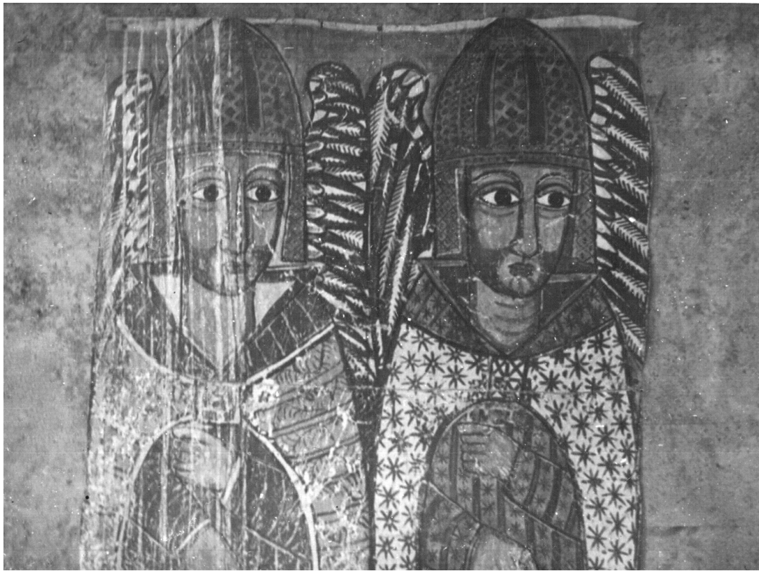
« Les prêtres du ciel » (peinture murale de l'église d'Abba Antonios, Gondar, XVII e siècle).