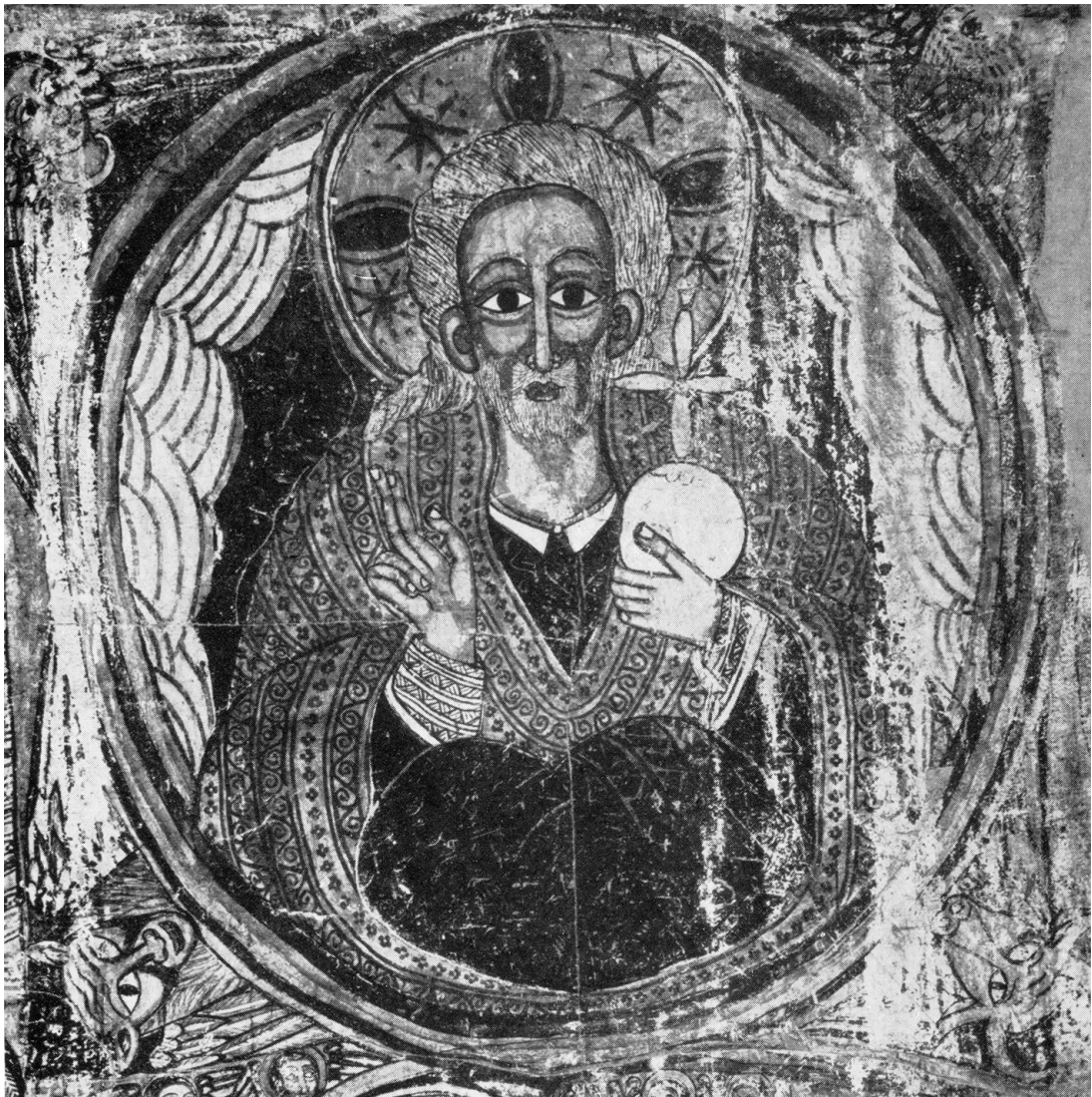
Dieu le Père (peinture murale de l'église d'Abba Antonios, Gondar, mur ouest du sanctuaire, XVII e siècle).