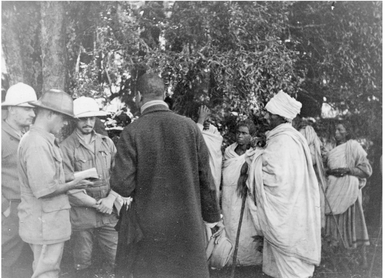
À Gondarotch Maryam, où Marcel Griaule, Michel Leiris et Éric Lutten échouent à remplacer les peintures de cette église, en raison de l'opposition des paroissiens (Gondar, 5 septembre 1932).