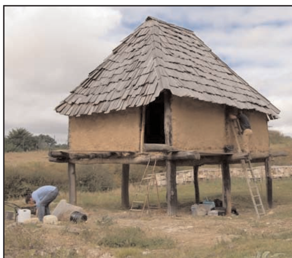
Fig. 6 : Couverture du grenier en bardeaux

Suite à la pose de la couverture en bardeaux