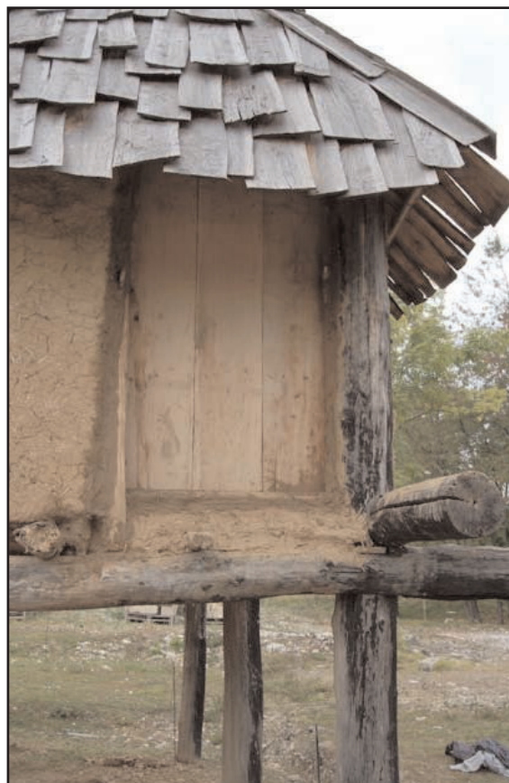
Fig. 15 : Vue de la porte mise en place