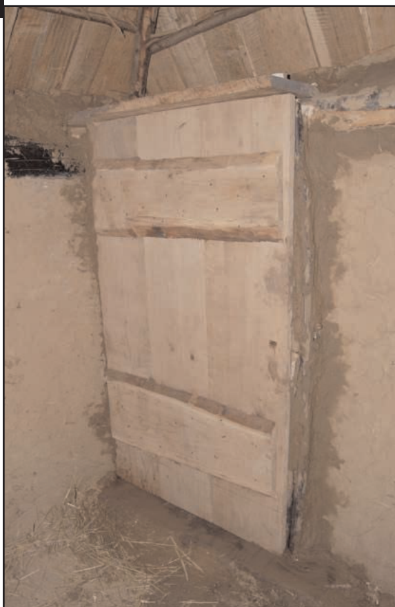
Fig. 14 : Colmatage du bâti dormant au torchis