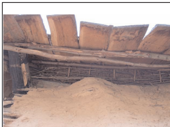
Fig. 7 : Colmatage en treillis de branches et torchis

en 2011 (fig. 6), nous avons constaté qu'il subsistait des jours importants entre le bas de la toiture et le haut des murs en pan de bois et torchis, c'est-à-dire entre le dernier rang des bardeaux et la sablière haute. Cette ouverture d'une dizaine de centimètres était susceptible de compromettre l'isolation du comble et le bon fonctionnement du grenier qui suppose que les récoltes stockées soient protégées des rongeurs et des oiseaux. Pour cette raison, nous avons colmaté cette ouverture pour constituer une sorte de cache-moineau en bois et torchis. Pour ce faire, nous avons réalisé une armature faite d'un treillis de petits branchages, entrelacés sur les dernières lattes de la couverture et les piquets débordants de la sablière des pans de bois (fig. 7). Sur ce treillis, une couche de torchis a été appliquée jusqu'au contact des bardeaux. De même, en sous-face de ce treillis servant d'armature,