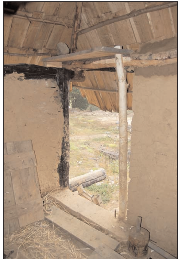
Fig. 12 : Réalisation du bâti dormant de la porte

de nombreux piétinements liés au chantier (fig. 9).