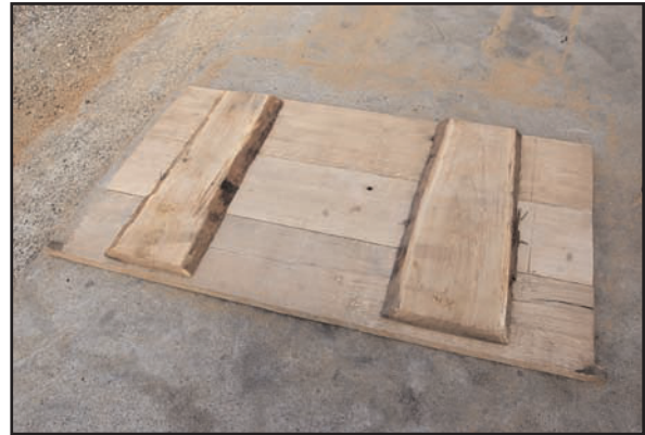
Fig. 11 : Fixation des traverses sur les trois planches par cloutage