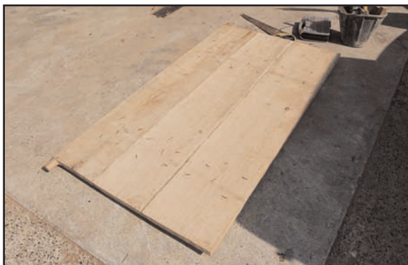
Fig. 10 : Vantail de la porte

Il en est de même pour le plancher et son isolation en sous-face par du torchis, qui a nécessité quelques remaniements en raison