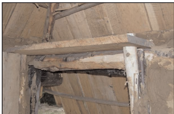
Fig. 13 : Fixation du linteau sur le montant

l'unique vantail et la quatrième, coupée en deux, a servi d'armature transversale pour solidariser les précédentes. Pour le battant, les trois planches ont été disposées verticalement, à jointure vive taillée à la hache, sans feuillure ni rainure (fig. 10). L'une de ces planches, la plus longue des trois, a été taillée de telle sorte à ménager aux extrémités un gond débordant, de section circulaire, autour duquel va pivoter