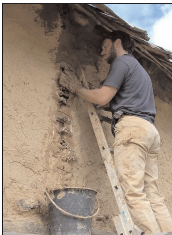
Fig. 8 : Entretien et réparation des cloisons en torchis

Parallèlement à ce travail, nous avons continué la réfection annuelle des parois en torchis, notamment celles exposées au nord-ouest, particulièrement exposées aux pluies