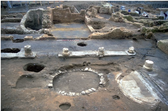
Fig. 126 – Vue depuis le nord de l'extrémité ouest du péristyle du bâtiment 6.