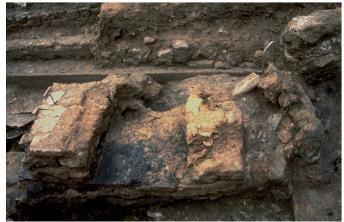
Fig. 127 – Vue depuis l'est des foyers culinaires retrouvés dans la cuisine du bâtiment 6.

fig. 434 ; Gros, 2001, p. 183, fig. 193). Il s'agit sans doute de la domus d'un des membres importants de l'élite locale 76 , maison destinée à afficher publiquement sa réussite et son prestige.