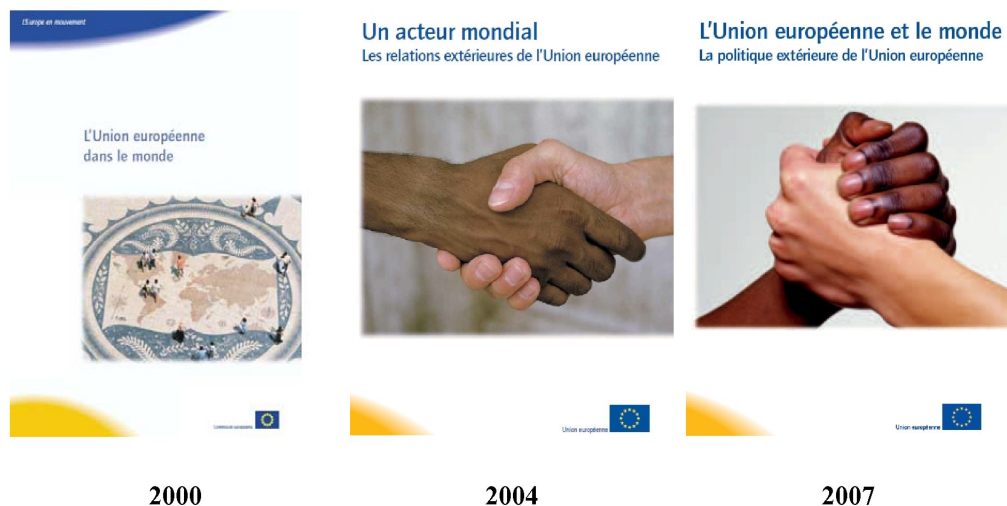
Figure 1. Couvertures des brochures L'UE dans le monde.