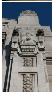
Stazione Centrale, inauguration 1931

Il est ici plus difficile de dissocier les caractÃ©ristiques du goÃ»t DÃ©co de l'apparat iconographique du rÃ©gime fasciste ; les effets de la prise de pouvoir du parti unique se remarquent dans les dÃ©corations de la gare : des logos du parti jusqu'Ã la prÃ©sence d'une