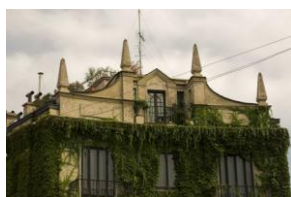
Immeuble rue Randaccio 9, Gi  Ponti 1924 1926

Nous utilisons trois entr es pour pr senter cette dynamique et pour poser les questionnements qui nous semblent incontournables. La premi re des trois entr es c'est un article de presse qui analyse des ventes aux ench res, la deuxi me une exposition tenue   Milan et contemporaine de l'article pr cit  et la troisi me la « mise en public » des  uvres de Gi  Ponti, architecte milanais, ic ne de la production Art D co.