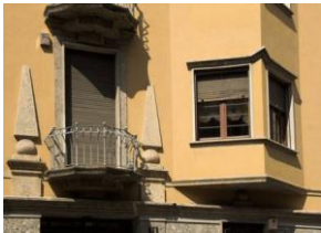
Immeuble rue Poerio, 11, arch. Greppi 19XX