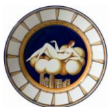
Assiette Donatella 1923

La figure de Giò Ponti est, en plus, glorifiée en 2002/2003 par la grande exposition itinérante Giò Ponti : a world , organisée et réalisée par le Design Museum de Londres (mai-octobre 2002), le Netherlands Architecture Institute de Rotterdam (octobre 2002-janvier 2003) et la Triennale de Milan (février-avril 2003). En effet, dans ces années 2000, il y a pratiquement toujours en exposition, en Italie, des œuvres de Giò Ponti, surtout ses objets de design et ses architectures des années 1950 (sans compter, bien évidemment, ce qui est exposé dans des musées, et notamment celui de Ginori di Doccia à Sesto Fiorentino et celui du design de la Triennale à Milan). Nous avons l'impression que les champs culturels de valorisation du Déco et de la production de Giò Ponti se sont partiellement superposés et ils ont tiré des avantages mutuels.