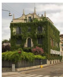
Immeuble rue Randaccio 9, Giò Ponti 1924 1926