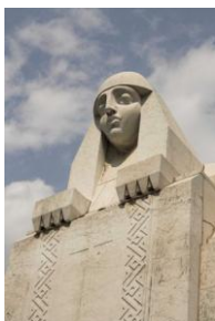
Cimetière Monumental, tombe Imperiali arch. A. Scala 1927

Le Cimetière Monumentale (inauguré en 1866, projet de Carlo Maciachini – www.monumentale.net ), demeure de sépulcres nobles et finement élaborés, fut un des sièges de l'exposition, sous la forme d'un parcours de valorisation des sculptures et des tombeaux Art Déco.