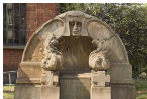
Cimetière Monumental, tombe A Cavallazzi, arch. A Cavallazzi, 1927

Bien que sa phase constitutive et productive se place dans les années 1920, on a commencé à parler d'Art Déco dans les années 1960, après la première rétrospective, tenue au Musée Galliére, Paris, en 1957 (Bossaglia, 1988). Si on parlait d'Art Déco, il restait la composante mineure du binôme Art Nouveau/Art Déco . Les spécialistes et la critique la plus attentive avaient déjà reconnu le détachement et l'autonomie des deux « Arts », mais celui-ci fut largement reconnu seule à la suite de la grande exposition parisienne réalisée en commémoration des 50 ans de celle, plus fameuse, du 1925.