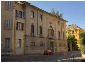
Immeuble en rue Santa Valeria, arch. Portaluppi 1924