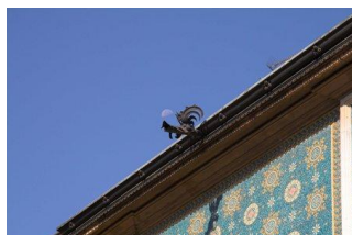
Villino Maria Luisa ; rue Tamburini, 8, 1924 – fers forg s par A. Mazucotelli

Ce texte analyse les dynamiques de valorisation de l'Art D co dans la derni re d cennie, en portant une attention sp cifique   la constitution d'un espace de r f rence pour les objets qui en Italie, bien souvent, sont qualifi s tous simplement de « D co ».