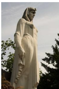
Cimetière Monumental, Monumento tombe Eberhart sculpteur A. Violi 1921

Nous remarquons qu'à l'occasion du Salone internazionale del mobile (salon annuel, www.cosmit.it ), la ville s'anime, à l'extérieur des espaces de l'exposition officielle, d'une multiplicité d'expositions, performances et rencontres culturelles liés aux œuvres et aux architectures réalisées par les architectes/designer d'aujourd'hui ( www.fuorisalone.it ). Cette grande richesse nous montre que la ville est capable de mettre en place des actes multiples, pluri événementiels et d'ordre culturel ; dans ce cas, le catalyseur de complexité est le Salone internazionale del mobile . Probablement la multitude de plans d'action mise en exergue en ces occasions est possible parce que il s'agit du goût/champ culturel actuel.