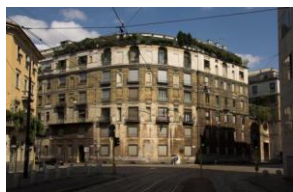
Cà Brutta, G. Muzio, 1920 - 1924