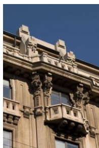
Immeuble en rue Carducci, 14 – ing. C. Urbano, 1924

Peut être que la reconnaissance si tardive de cette entité artistique est à relier à la composition de sa substance génératrice ; c'est-à-dire une expression formelle non soutenue par une construction intellectuelle conséquente. Sa presque coïncidence temporelle avec le développement du très puissant Mouvement Moderne ne lui a pas facilité la tâche car ce dernier eut une occupation presque totale de l'espace critique.