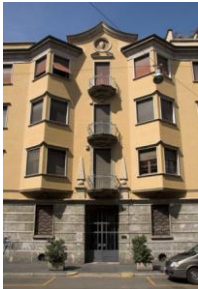
Immeuble rue Poerio, 11, arch. Greppi 19XX