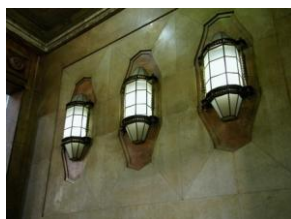
Stazione Centrale, inauguration 1931

Le trÃ¨s long processus de rÃ©alisation de la gare lui a donnÃ© la possibilitÃ© d'enregistrer une partie des modifications en cours dans les premiÃ¨res dÃ©cennies du XX Ã¨me siÃ¨cle. ConÃ§ue dans un Ã©clecticisme tardif, elle voit rÃ©aliser ses dÃ©corations dans les annÃ©es 1920 et au tout dÃ©but du Novecentismo , sans manquer, bien Ã©videmment, la pÃ©riode Art DÃ©co, dans ce cas spÃ©cifique, esthÃ©tiquement proche de la Sezession viennoise.