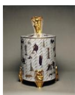
Une cista : Conversazione classica , 1925

L'exposition valorisait principalement la production décorée avec des sujets classico-mythologiques et architecturaux. En effet, c'est dans ces pièces que l'expression de Ponti se développa de façon la plus significative. Les figurine (petites figures, le mot utilisé à Doccia) pontiennes furent une riche série de personnages qui habitaient principalement les Passeggiata archeologica et Conversazione classica (Promenade archéologique et Conversation classique). Elles marquèrent tellement l'esprit que la Manifattura di Doccia les a (re)interprétée pour les introduire dans la production actuelle, la série des Pontiane , vrai exemple de néo-Déco.