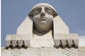
Cimetière Monumental, tombe Imperiali arch. A. Scala 1927