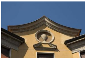
Immeuble rue Poerio, 11, arch. Greppi 19XX