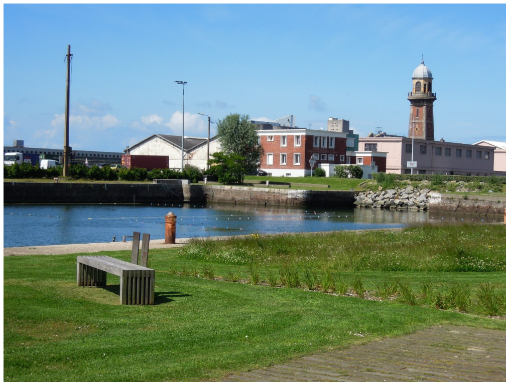
Figure 4. Reconquête paysagère de la zone industrialo-portuaire par la patrimonialisation