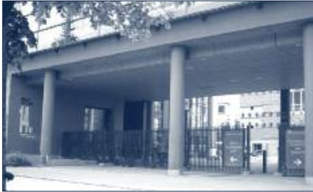
Entrée de la Cité des Territoires

À l'inverse, depuis les fenêtres des bureaux et des salles de classe de la Cité des Territoires, le quartier de Villeneuve se présente à son tour comme une forteresse. La barre d'immeuble est imposante. L'ouverture visuelle récemment créée par la démolition de la montée du n°50 a été rapidement cachée par le nouveau parking à plusieurs étages.