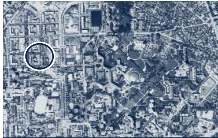
Image satellite de Villeneuve. La Cité des Territoires est identifiée par un cercle.

une rue piétonne : la galerie des Baladins. Dans les années 80, des habitants pouvaient participer à la vie de l'École ; les enseignants-chercheurs et les étudiants à la vie des quartiers de l'Arlequin et des Baladins. Cependant, au fil du temps, les difficultés non surmontées ont conduit l'École à se replier sur elle-même et à s'isoler de son environnement immédiat. Avec l'aménagement de son entrée sur la rue de Constantine, l'École d'Architecture tourne physiquement le dos aux immeubles d'habitat social. Néanmoins, elle est un élément structurant de Villeneuve.