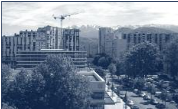
Vue sur Villeneuve depuis les bureaux de l'Institut de Géographie Alpine

À l'inverse, depuis les fenêtres des bureaux et des salles de classe de la Cité des Territoires, le quartier de Villeneuve se présente à son tour comme une forteresse. La barre d'immeuble est imposante. L'ouverture visuelle récemment créée par la démolition de la montée du n°50 a été rapidement cachée par le nouveau parking à plusieurs étages.