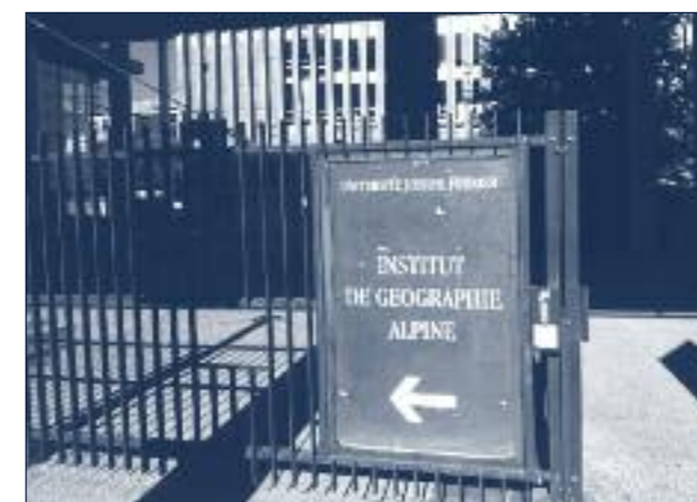
Entrée de l'Institut de Géographie Alpine

lesquels elle est implantée. Nous observons qu'elle s'investit auprès d'autres publics, notamment auprès des collectivités territoriales. Parallèlement, il est frappant de voir que les chercheurs ne connaissent pas forcément bien les sujets d'étude des uns et des autres, indice que les liens se font plus sur le plan thématique que par proximité géographique. L'image qui se dégage est celle d'une université hors sol. Et pourtant, en même temps, nous rencontrons du côté de certains universitaires, une envie de travailler avec d'autres méthodes afin de répondre aux questions de société là où elles se posent.