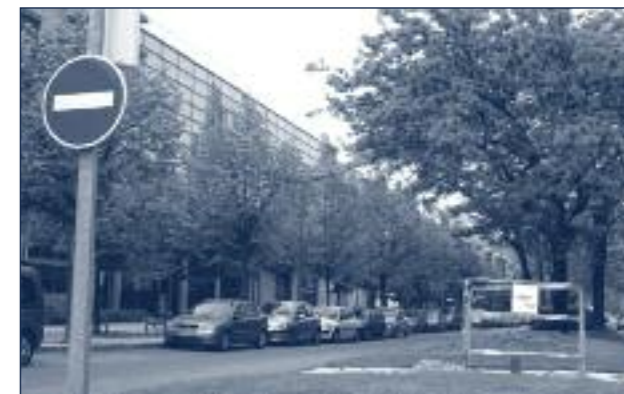
L'avenue Marie-Reynoard séparant Villeneuve et la Cité des Territoires (bâtiment à gauche)

Vue depuis le quartier de Villeneuve, l'avenue Marie Reynoard, longeant les bâtiments de l'Institut de Géographie Alpine (IGA) et de l'Institut d'Urbanisme (IUG), peut facilement être comprise comme une frontière physique, séparant les habitants des institutions universitaires.