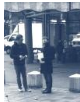
◀ Place du Marché à Villeneuve. Des étudiants en pleine séance de travail...

Un sujet au cœur des débats est celui de la posture des chercheurs-enseignants et des étudiants dans le désir de travailler ensemble sur leurs représentations du quartier et inversement. Cette relation est parfois problématique, comme en témoigne un habitant : « J'ai l'impression, lorsque je vois débarquer des groupes d'étudiants, que ce sont des ethnologues qui viennent étudier les indigènes dans leur réserves. Nous ne sommes pas des cobayes ».