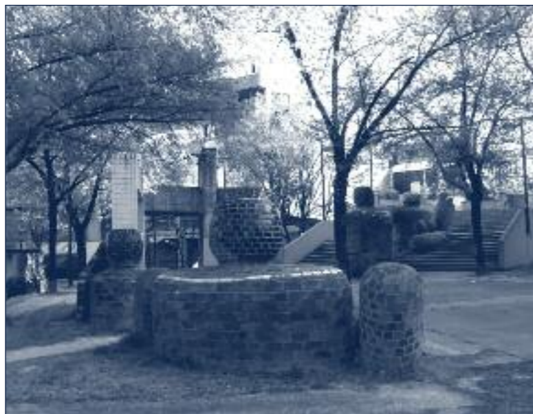
◀ Sculpture urbaine à Villeneuve, de K. Schultze, représentant des géants assis, couchés et désarticulés.

rience du community organizing à Grenoble(1). Ce dernier groupe réfléchit à des méthodes alternatives dans le domaine de la planification urbaine, inspiré de l' advocacy planning .