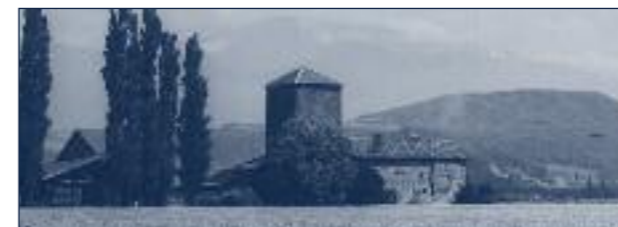
◀ Avant 1967, la Ferme Prémol au milieu des champs, (source : villageolympiquegrenoble.blogspot.fr )

sur le lien entre l'université et le territoire à Grenoble, en particulier dans le sud de la ville.