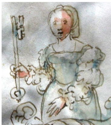
p. 4 (dét.)

Besançon, Bibliothèque municipale, ms. 159