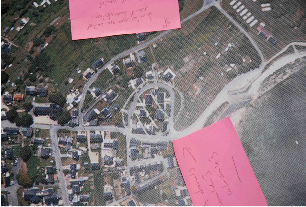
Photographie 3 : Repérage d'un ancien douet au niveau de la grande plage.

On peut penser que les douets étaient alimentés par le cours d'eau du Blavet, formant alors un exutoire. L'urbanisation les aura sans doute fait disparaître.