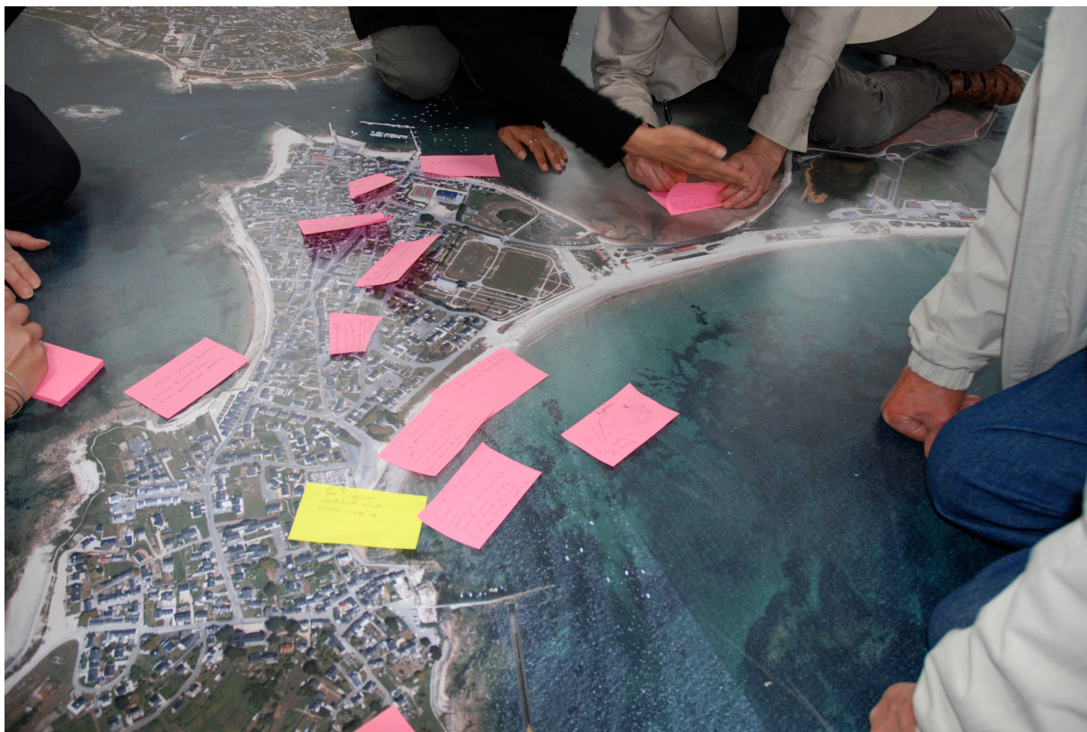
Photographie 1 Extrait de la photographie aérienne et de l'enquête à Gavres (photo Anne Tricot, mai 2011).