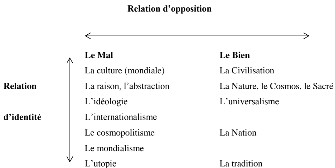
(Figure 1 : Mal vs Bien)

Le Front national propose, à travers l'ensemble du programme, un recadrage idéologique de la société française. Celui-là se manifeste dans l'opposition du Mal et du Bien et la proposition de passage de l'un à l'autre (figure 1).