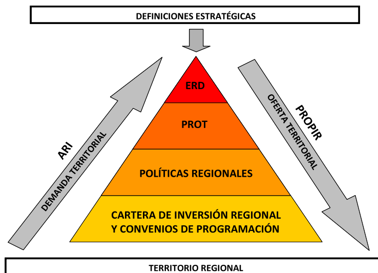
Figura 1. Esquema del Sistema Regional de Planificación