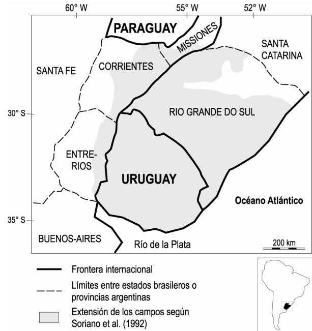
Figura 1. Localización de los campos.

Este artículo analiza las razones del acceso tardío de los pastizales a un estatuto ecológico, relativamente a otras formaciones vegetales, tomando como ejemplo a una facies particular de los pastizales del Río de la Plata, los “campos” (Fig.1). Estos últimos son paisajes que abarcan al