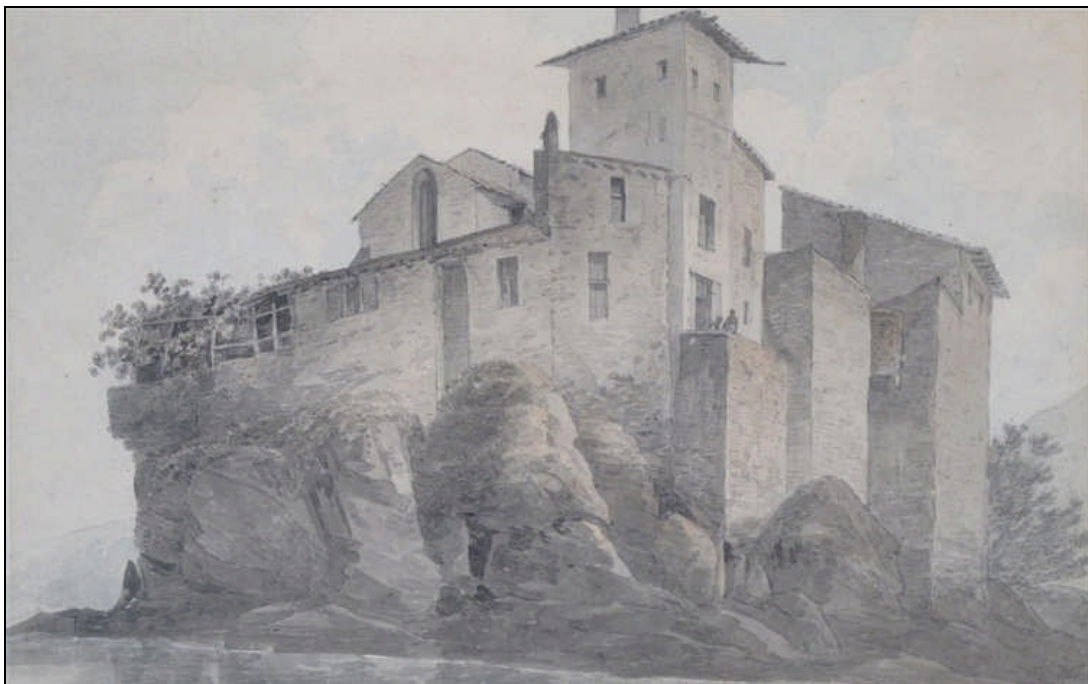
Fig 2 : John Webber, On L'Isle Barbe, Lyon, 1787 , aquarelle, 23 x 37 cm, localisation inconnue. Domaine Public.