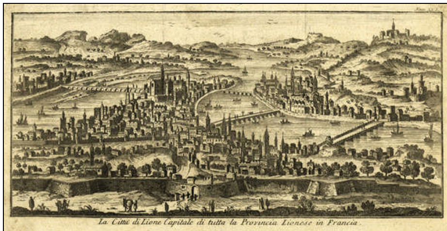
Fig 6 : Giambattista Albrizzi (imprimeur), La Città di Lione Capitale di tutta la Provincia Lionese in Francia , 1748, gravure sur cuivre, 15,2 x 31,7 cm. Domaine public. Cette estampe a été publiée dans l'ouvrage de Thomas SALMON, Lo stato presente di tutti i paesi e popoli del mondo naturale, politico e morale: con nuove osservazioni e correzioni degli antichi, e moderni viaggiatori. Vol. 16. Della Francia , 1748, entre les pages 180 et 181.