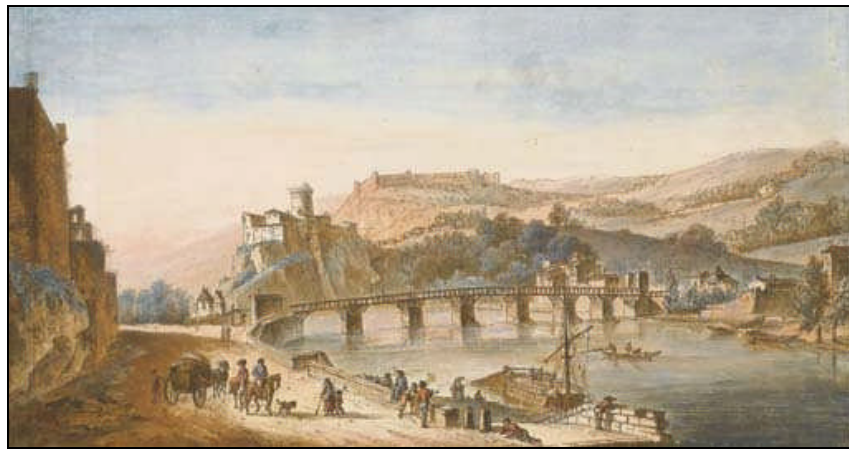
Fig 3 : Victor-Jean Nicolle, Une vue du château de Pierre Scize à Lyon , fin du XVIII e siècle, aquarelle, 34,5 x 65,4 cm, localisation inconnue. Domaine public.

L'entrée nord de Lyon, par la Saône, concentre près de la moitié des points de vue. Ces représentations confirment l'importance considérable du site de Pierre-Scize dans le paysage lyonnais de l'époque. Ce lieu était déjà l'un des sujets favoris des artistes hollandais et flamands au XVII e siècle 5 . Situé sur la rive droite de la Saône, il occupe un emplacement stratégique, dominant la principale voie d'accès à la ville. Le site possède aussi un caractère pittoresque très affirmé qui ne manque pas de retenir l'attention des artistes et des voyageuses britanniques, comme Lady Craven 6 . Plus largement, c'est toute l'entrée nord de Lyon par la Saône qui constitue alors un défilé impressionnant. Les voyageurs arrivant par le coche d'eau ou la route aperçoivent sur la rive gauche de la rivière le fort Saint-Jean et le grenier d'Abondance, et sur la rive droite, le rocher, la porte et le château de Pierre-Scize ( fig. 3 ).