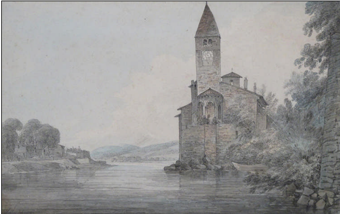
Fig 1 : John Webber, Notre Dame de l'Isle Barbe, Lyon, 1787 , aquarelle, 23 x 37 cm, localisation inconnue. Domaine Public.

comme un élément incontournable, puisqu'elle est présente dans plus des deux tiers des images, tandis que le Rhône est visible dans moins d'une œuvre sur cinq.