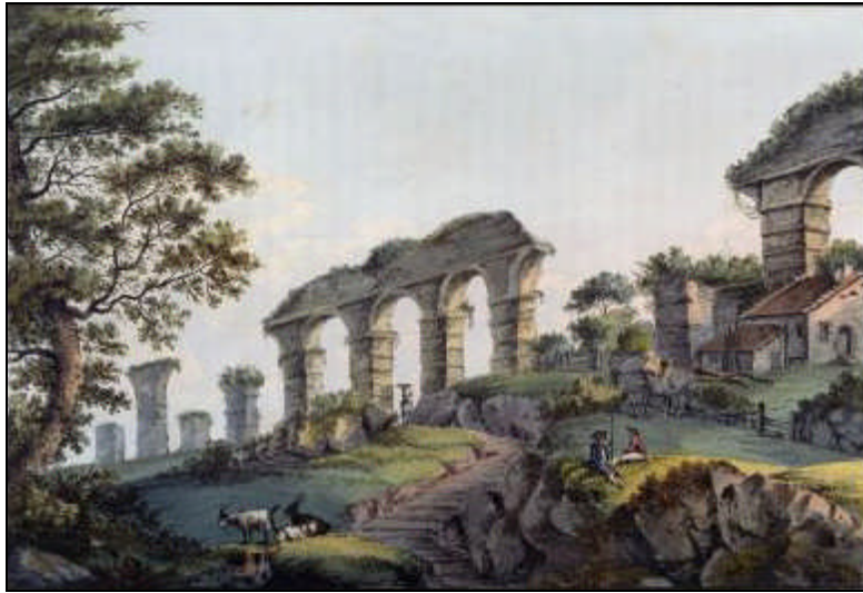
Fig 8 : Jean-François Albanis de Beaumont, Restes de l'aqueduc romain près de Lyon , 1800, gravure coloriée, 19,5 x 29 cm. Domaine Public.

Les recherches menées sur l'iconographie lyonnaise de l'époque moderne mettent en lumière la place occupée par les voyageurs dans la production d'images urbaines. Situé au carrefour des principales routes, Lyon constitue alors une étape majeure pour ceux qui se rendent en Italie. La ville a suscité l'intérêt de ces artistes, qui ont tenu à conserver par le dessin le souvenir de leur passage à Lyon. Ces œuvres constituent des sources précieuses, permettant notamment de prendre conscience de l'importance du site de Pierre-Scize dans le paysage lyonnais au XVIII e siècle. Par ailleurs, l'existence de copies d'anciennes représentations de la ville témoigne de la large circulation des images urbaines en Europe. Il n'est pas étonnant que des éditeurs d'estampes étrangers aient possédé des vues gravées de Lyon. Il est donc possible que les voyageuses britanniques aient également eu connaissance de ces images anciennes avant leur venue à Lyon, que ce soit sous forme d'estampe volante ou par la consultation d'ouvrages imprimés.