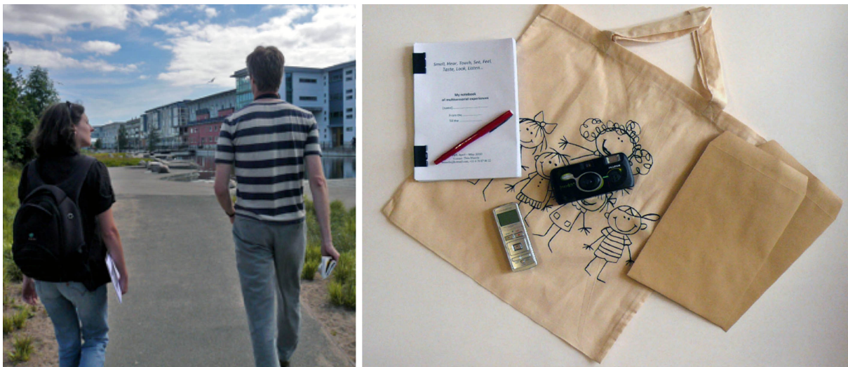
Figure 2. Parcours et baluchon multisensoriels