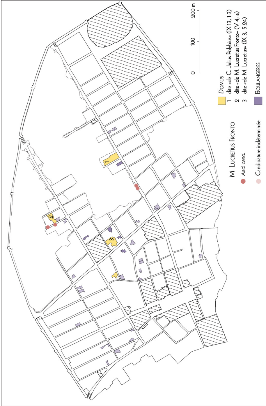
Fig. 2. Répartition des placards pour la candidature de M. Lucretius Fronto comme édile (DAO N. Monteix).