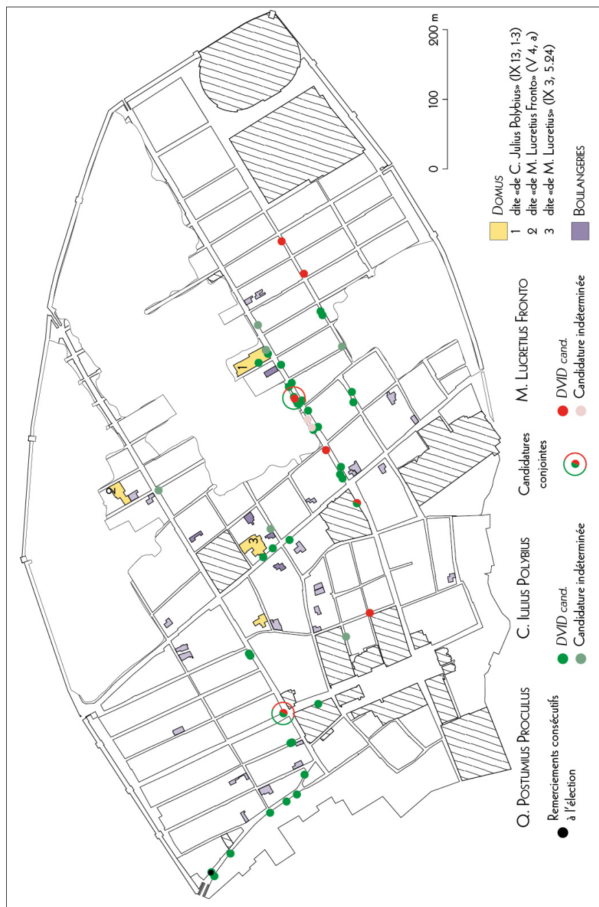
Fig. 4. Répartition des placards pour les candidatures de M. Lucretius Fronto et de C. Julius Polybius comme duumvir iure dicundo (DAO N. Monteix).