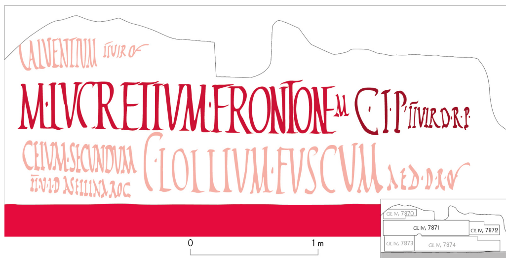
Fig. 5. Façade la maison IX 11, 3. L'inscription CIL , IV, 7871 paraît avoir respecté CIL , IV, 7872, probable témoignage d'une alliance entre M. Lucretius Fronto et C. Iulius Polybius pour la brigade du duumvirat [DAO et mise à l'échelle N. Monteix, d'après cliché SANP (ex P 717)-C446, pris en 1912 (cf. Varone & Stefani 2009, 429)].

Suite à la découverte de nombreux placards en façade de la maison IX 13, 1-3, M. Della Corte a proposé de voir en C. Iulius Polybius le propriétaire de la maison (fig. 6) 33 . Pourtant, certaines inscriptions lues après la fouille de l'intégralité de la maison dans les années 1970 renvoient vers C. Iulius Philippus, possible affranchi impérial 34 . Son sceau en bronze a été découvert rangé dans un meuble du péristyle 35 ; dans un graffiti, inscrit sur le laraire situé dans la cuisine de cette maison, P. Cornelius Felix et Vitalis expriment des vœux pour le retour sain et sauf de Philippus d'une probable campagne militaire, ce qui arriva 36 . En face de la maison, un placard électoral pour un candidat au nom mutilé s'adressa à Philippus : s'il faisait élire le candidat, ce dernier ferait de Polybius son collègue 37 . Cette affiche, véritable propagande ad personam , oblige à considérer que Philippus pouvait lire cette invite pendant l'une des campagnes de Polybius. Cette présence dominante de Philippus ne réduit pas la fréquentation de la maison par Polybius à néant : directement interpellé par A. Rustius Verus pour faire voter pour lui, son nom pourrait avoir été exploité comme rogator fictif par le même et par un certain Severus 38 . Plus complexe est