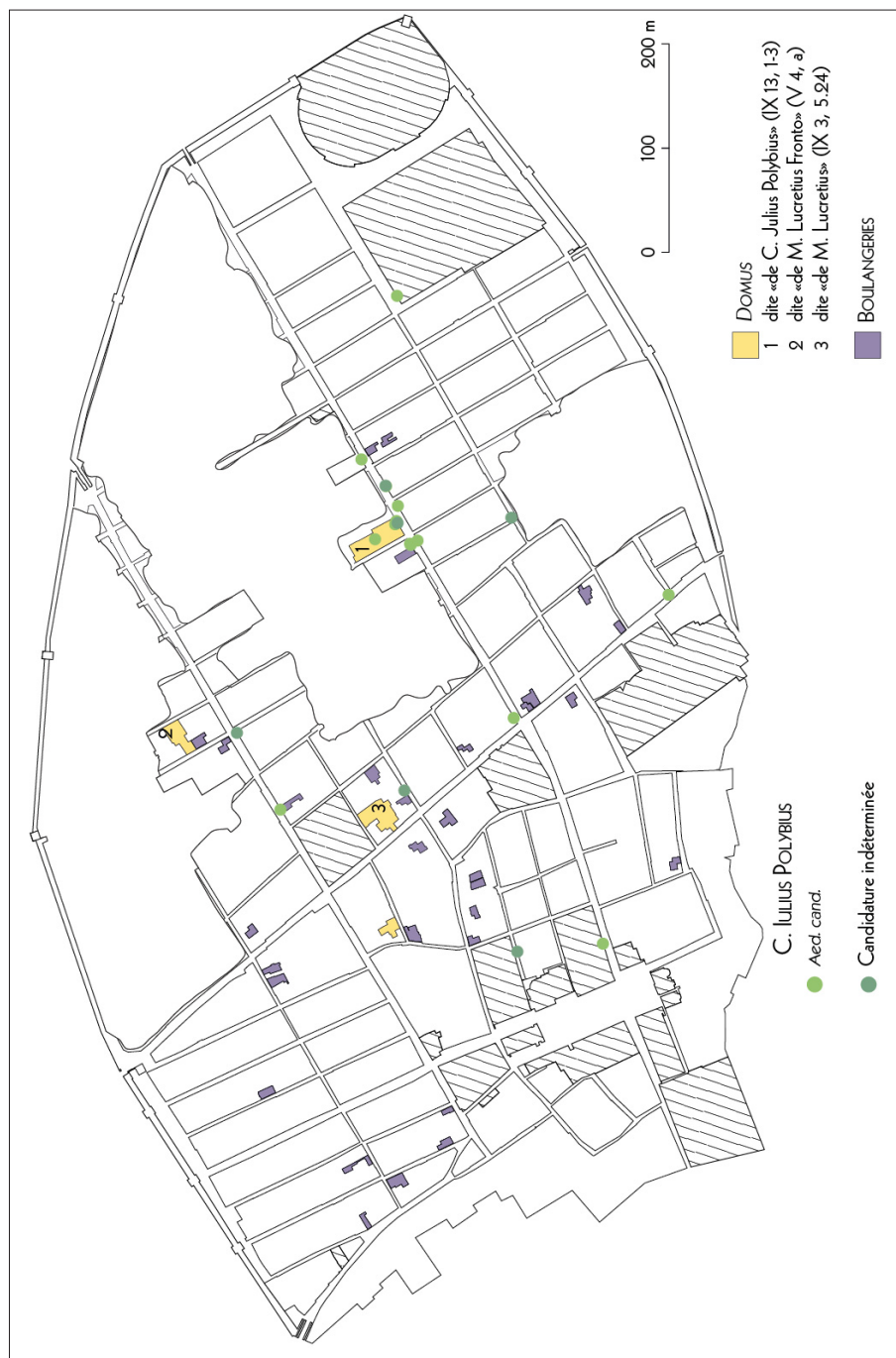
Fig. 3. Répartition des placards pour la candidature de C. Iulius Polybius comme édile (DAO N. Monteix).