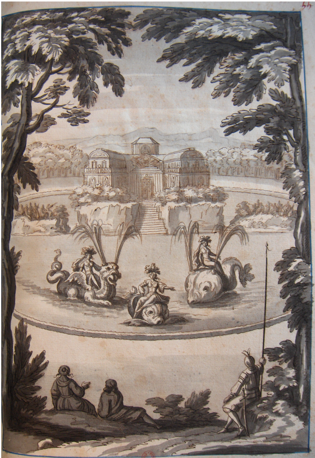
Illustration 2 : Les Plaisirs de l'Isle enchantée ordonnez par Louis XIV roi de France et de Navarre. Ms. Fr. 16635. Illustration de la troisième journée, f°78.