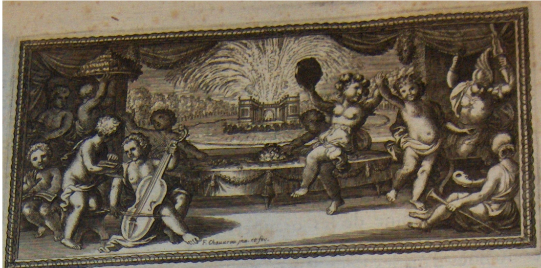
Illustration 3 : Les Plaisirs de l'isle enchantée, course de bague : collation ornée de machines ; comédie, meslée de danse et de musique, ballet du palais d'Alcine ; feu d'artifice : et autres festes galantes et magnifiques, faites par le Roy à Versailles, le VII. may M.DC.LXIV et continuées plusieurs autres jours , Paris, Imprimerie Royale, 1673, p. 3.

confirmé et précisé par ces différentes éditions : on constate en effet que ce lien n'est pas naturel ou spontané, mais bien construit et préservé par une institution.