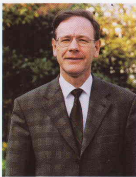
Gérard-François DUMONT* Recteur et Professeur à la Sorbonne

Q : Dans un dernier ouvrage qui est déjà une référence 1 , vous analysez l'impact des changements climatiques sur les populations. Avec ces projections, comment évaluez-vous l'évolution des besoins d'infrastructures ?