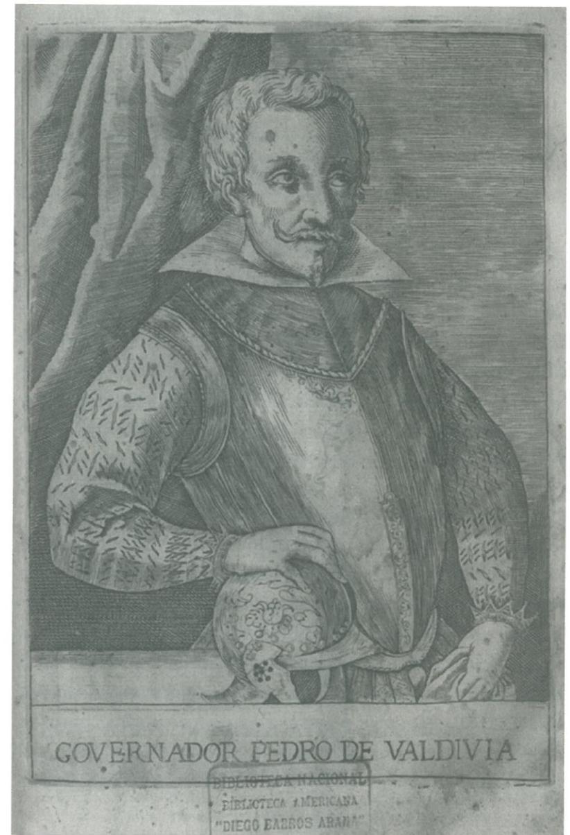
Fig. 1. Retrato del gobernador Pedro de Valdivia, en «Historica relacion del Reyno de Chile», Alonso de Ovalle, 1646.