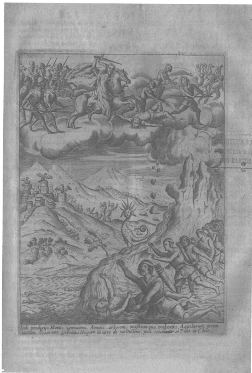
Fig. 3. Hechos milagrosos que precedieron a las paces de Baydes, en «Historica relacion del Reyno de Chile», Alonso de Ovalle, 1646. Memoria Chilena. Dibam, Chile.

Sin embargo, los colonos debían resignarse a vivir en estas nuevas tierras e iniciar procesos de apropiación. Portador a la vez del imaginario medieval y del método humanista, Gerónimo de Vivar es el primer europeo que describe de manera precisa el espacio chileno. Aunque su obra haya permanecido como manuscrito hasta el siglo XX, no deja de ser reveladora y fundacional de imaginarios europeos e hispanoamericanos a propósito de Chile. Lejos de establecer una visión romántica del espacio, Vivar entrega los conocimientos necesarios para la colonización. Se puede medir aquí la capacidad de la Corona de reunir tales informaciones sobre sus territorios recién conquistados –recordemos que la crónica de Vivar circuló aparentemente en el Consejo de Indias—. Espontáneamente, el conquistador Vivar fue capaz de describir de manera rigurosa el espacio chileno. Pensó y organizó el territorio en valles potencialmente habitables, y catalogó los recursos explotables para los futuros colonos. Esta descripción «utilitarista» de Chile se puede poner en relación con toda una bibliografía de promoción del país, prospectos llamando a la emigración y a la colonización. Sabemos que este tipo de representación persistió hasta épocas más recientes 79 .