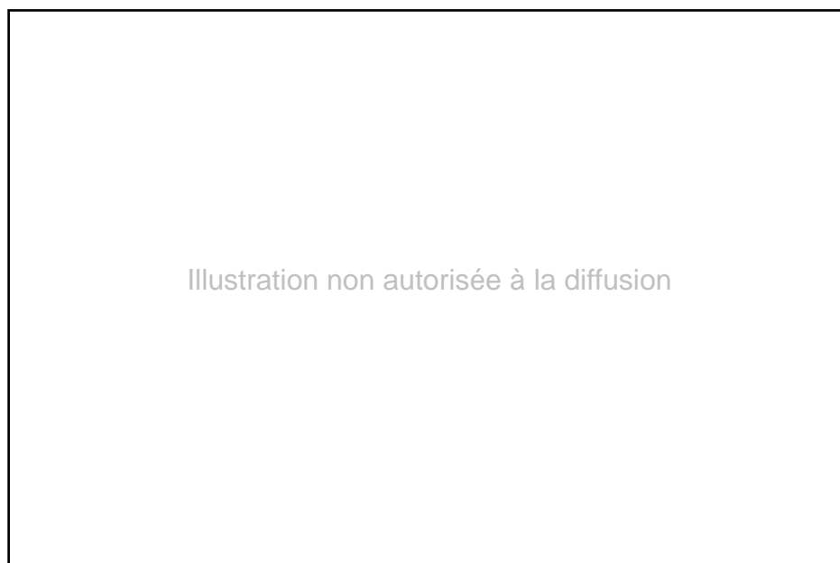
FIG. 4. — Petit quartier en ivoire de la selle à monter de Pierre III, représentant l'aigle impérial (Musée du Louvre, Paris)

siècles durant, c'est bien le dragon, monstre apocalyptique et terrifiant, hâtant la fin du monde, qui avait surplombé, du haut du casque des rois et des infants d'Aragon, leurs adversaires.