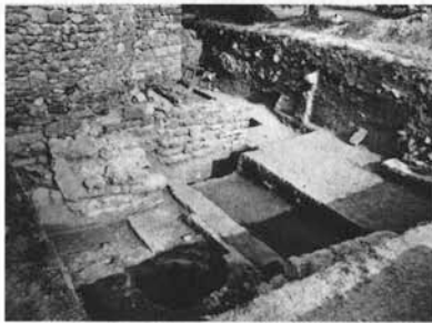
Fig. 2: Vue des fouilles au chevet de l'église de La Gayole.

Par ailleurs, il faut souligner l'attention accordée par Gabrielle Démiens d'Archimbaud à la définition d'un protocole méthodologique. La qualité des techniques de fouilles stratigraphiques et de l'enregistrement des données sur les chantiers qu'elle a dirigés est reconnue à l'échelle nationale, comme l'illustrent les diverses coupes stratigraphiques de La Gayole et de Saint-Victor publiées avec leurs commentaires dans le manuel d'archéologie de Michel de Boüard.