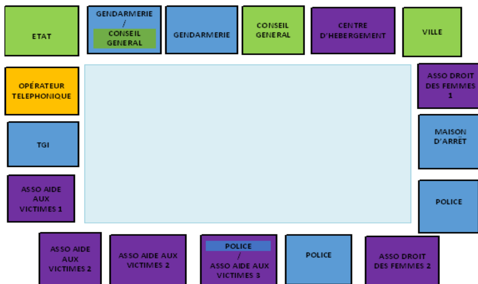
Répartition des personnes présentes à la table de réunion du Comité de pilotage en fonction de leurs institutions d'appartenance (Réunion du 4 septembre 2014)

Enfin l'objectivation statistique des personnes assistant au Comité de pilotage démontre l'existence d'un « troisième cercle », celui des « observateurs ». En effet, instance nouvelle en charge d'un dispositif expérimental, le Comité de pilotage est aussi un lieu qui se « visite » pour comprendre le fonctionnement du TGD et les conditions de sa mise en pratique concrète par les professionnels susceptibles d'y être associés. Ainsi, sur les 92 personnes différentes ayant assisté au moins une fois aux réunions du Comité de pilotage entre le début de l'année 2011 et jusqu'au printemps 2015, 25 personnes étaient soit des professionnels d'autres régions, soit des personnes réalisant un « stage » dans l'une des différentes structures y participant de manière plus ou moins régulière. Présents dans près de deux tiers des réunions, leur nombre oscille en moyenne entre un et deux à chaque fois.