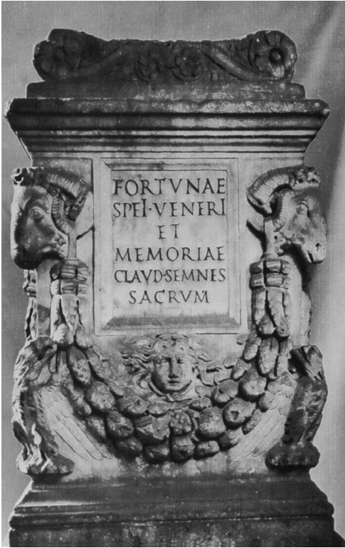
Fig. 2. Rome, autel du mausolée de Claudia Semnè (d'après Wrede 1971, pl. 77).

et à la mémoire de Claudia Semnè » 15 . Selon une ambivalence qui a jadis été soulignée par P. Veyne, l'autel est à la fois une offrande et l'objet commémorant l'acte de consécration lui-même et les gestes rituels qui ont accompagné la dédicace (Veyne 1983, p. 288). La formulation qui fait apparaître la mémoire de la défunte au tout dernier rang des dédicataires respecte la hiérarchie entre les entités à qui M. Vlpus Crotonensis a souhaité vouer le monument. En outre, celles-ci ne rentrent pas dans la même catégorie et ne se situent pas sur le même plan. D'un côté sont invoquées des divinités appartenant au panthéon romain que l'on peut qualifier de traditionnel et dont la sphère d'action ne possède pas de lien apparent ou direct avec le monde des morts ; de l'autre, le souvenir de la disparue. L'interprétation de la memoria dans la formulation de la dédicace n'est pas totalement dépourvue d'équivoque. Celle-ci, comme on sait, fut parfois associée aux dieux Mânes dans les dédicaces d'épithèses, au point de devenir dans certaines régions de l'Empire un élément à part entière du formulaire conventionnel. Il n'est pourtant pas complètement certain, comme on l'a parfois suggéré et en dépit de certaines formulations amphibologiques, qu'il se soit