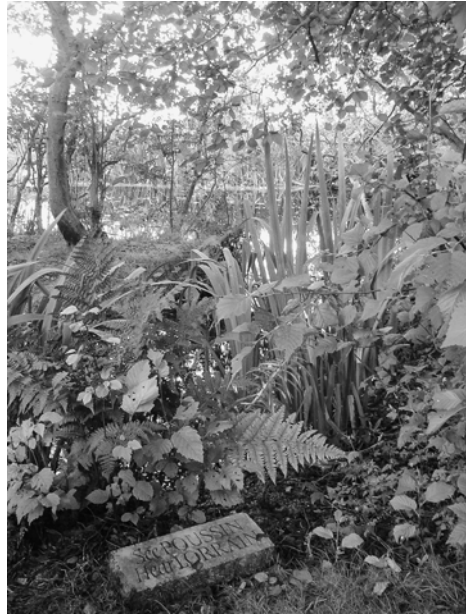
3. Little Sparta, Dunsyre, Lanarkshire, Écosse (Hervé Brunon).

symétrie ou irrégularité, composition ou encore description. Pour Philippe Nys, par exemple, le jardin comme « lieu utopique d'une "fraternité des arts" » est d'abord lié « à un secret de fabrication , celui de la création artistique comme traduction des différents modes de représentation entre eux, avec au centre et comme point de départ de ce secret le processus de la description [ekphrasis] comme incarnant un principe de traductibilité ». 102 Au sein du jardin, l'ensemble des arts concourent aussi à la 'représentation' plus ou moins précise d'un mythe ou d'une source textuelle (le paradis, le locus amoenus de la tradition pastorale classique, le jardin des Hespérides, etc.) ou rivalisent 'de concert' à imiter la puissance créatrice de la nature elle-même ( natura naturans ). 103 Dans cet élan commun se forgent des langages hybrides