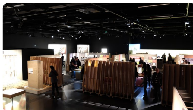
Vues de l'exposition 'Ma terre première pour construire demain' au Musée des Confluences