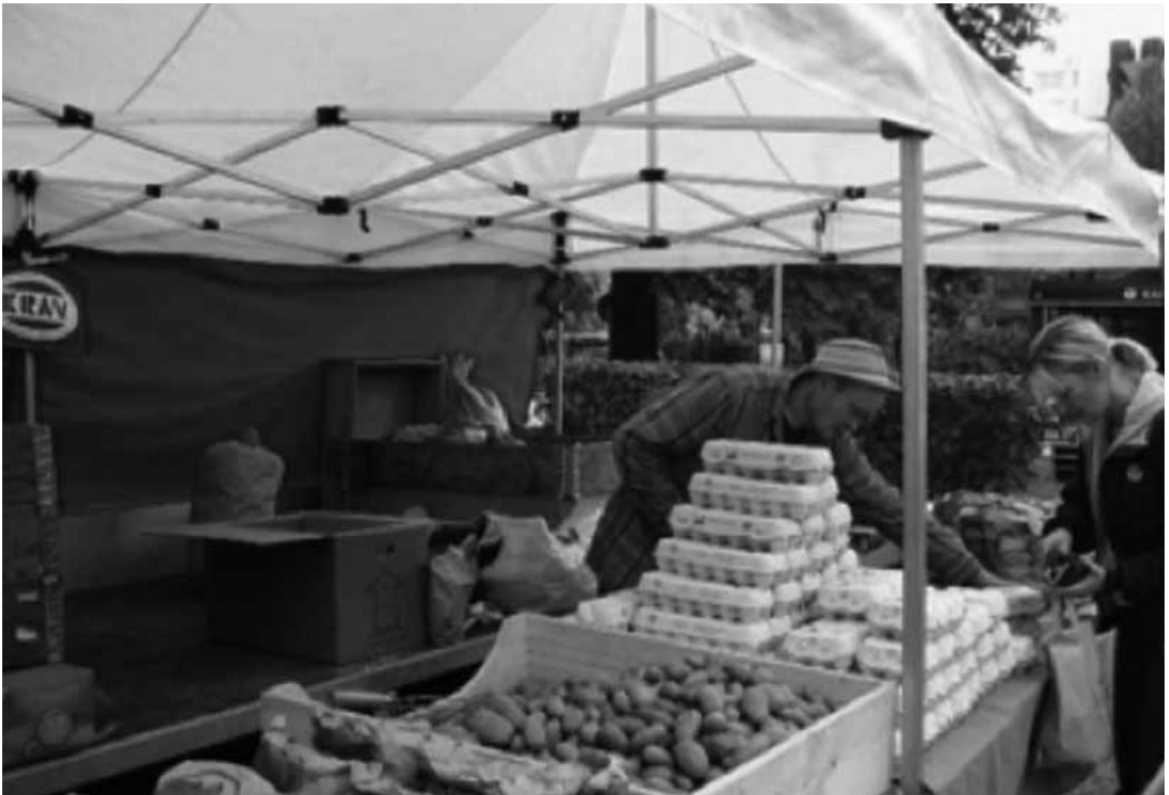
Photo 2 : Les marchés fermiers « Bondens Egen Marknad » à Stockholm (cl. C. Hochedez – 2008) Farmers' market « Bondens Egen Marknad » in Stockholm City

À Buenos Aires sont mis en évidence deux types de réseaux : les familles élargies et les associations à l'origine des marchés de gros, apparentées à des coopératives, mais qui sont aussi des lieux de rassemblement de la collectivité (fêtes, tournois sportifs). Les réseaux sociaux ont facilité la connexion des espaces de production aux réseaux de commercialisation et les circulations croissantes des Boliviens au sein de l'Aire métropolitaine. En effet, l'obtention d'un emplacement dans un marché de gros se fait généralement sur information d'un parent proche ou lointain, et