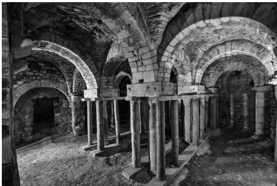
Fig. 17 – ENTREPIERRES, prieuré de Vilhosc. Vue de la partie orientale de la crypte depuis le sud-ouest.

Les chapiteaux et les colonnettes d'albâtre de Saint-Geniez semblent bien provenir d'un approvisionnement local, dans des gisements situés à proximité du site. Leur disposition dans l'édifice pourrait toutefois suggérer qu'il s'agit d'éléments remployés, même si leur facture est romane.