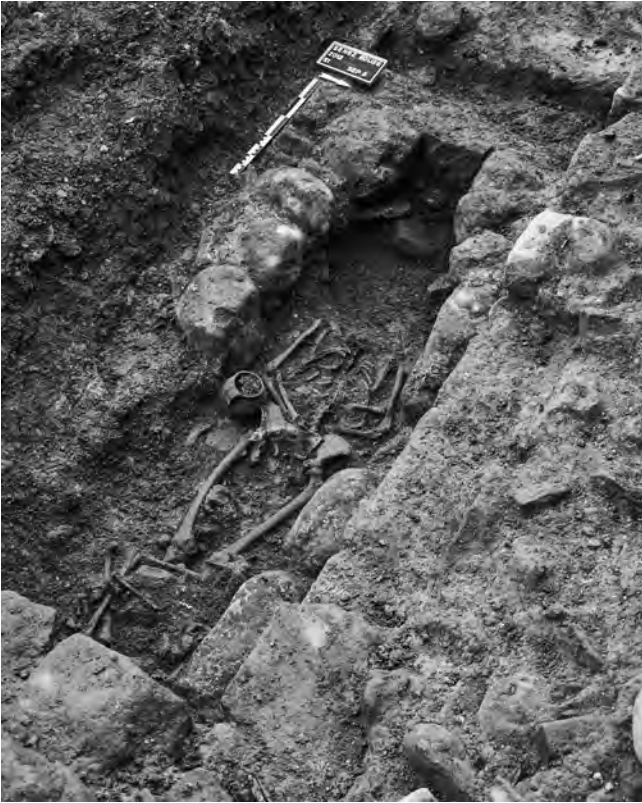
Fig. 12– SENEZ, place de l'église. Vue de la sépulture US 5 depuis le nord-est (cliché SDA04).

De manière générale, la stratification – principalement formée de remblais mêlés à des dépôts alluvionnaires – est extrêmement importante sur l'ensemble de la zone diagnostiquée, parfois supérieure à 1 m sous les niveaux contemporains, soit plus de 2,50 m sous le niveau de sol actuel. Ni le substrat géologique ni les niveaux stériles n'ont été atteints lors du diagnostic.