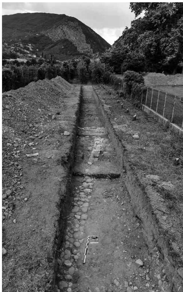
Fig. 9 – ENTREVAUX, parc de Glandèves. Vue d'ensemble de la tranchée Tr. 3 depuis l'est.