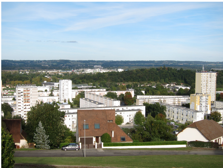
(Cliché S. Clarimont, octobre 2013)