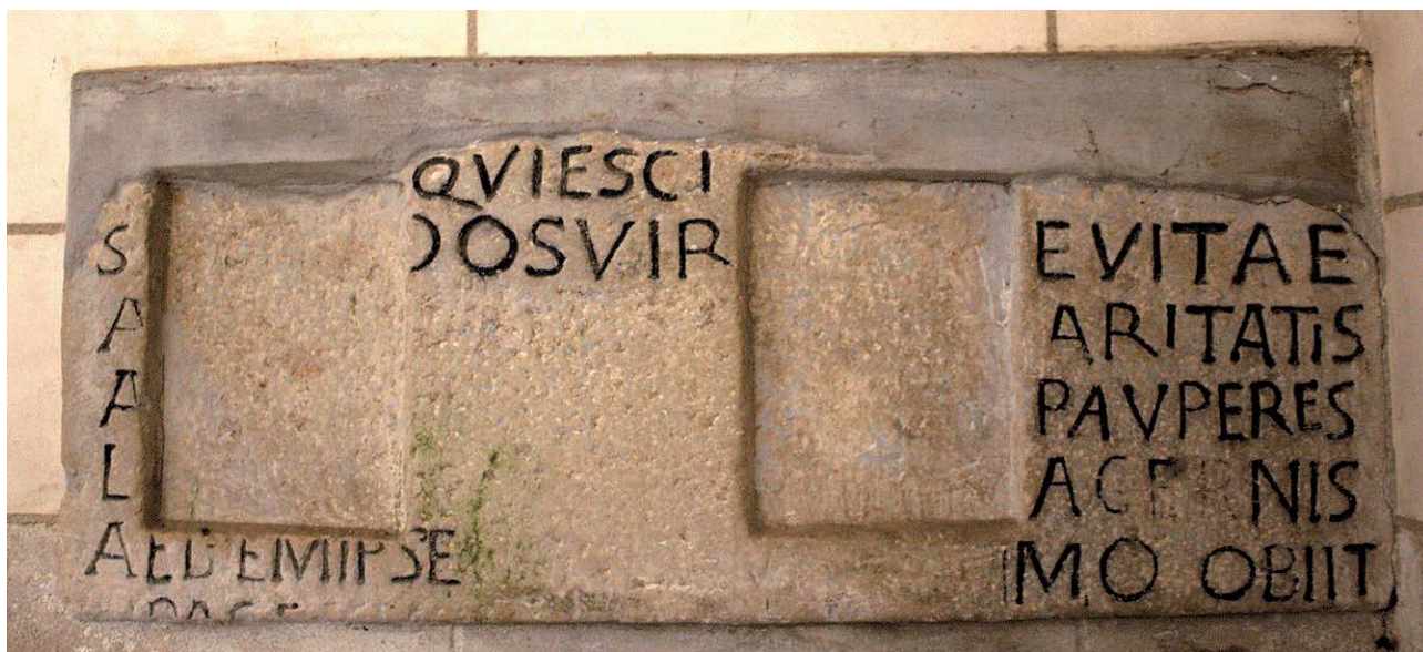
Document 4. Saunay, église Notre-Dame : épitaphe d'Alderamnus.

L'inscription actuellement visible dans l'église Notre-Dame a été réalisée en 1847 d'après un relevé réalisé en 1720 et reproduit, à une échelle légèrement réduite (99,5 x 50 cm), l'original dont ne subsistent sur place que quelques lignes mutilées. Elle était vraisemblablement déposée à l'origine sur la sépulture du prêtre Alderamnus, mort le 14 avril 874. Le texte utilise des formules très courantes à l'époque carolingienne pour dresser le portrait idéal d'un défunt dont le seul élément biographique réside dans la mention de son rôle de fondateur :