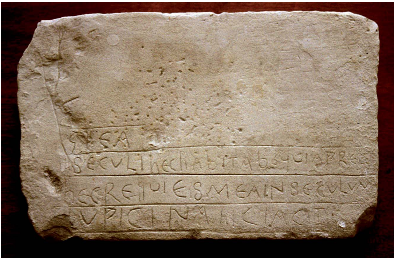
Document 2. Pussigny : endotaphe de Lupicina.

Bien qu'on ignore le contexte précis de sa découverte, on peut supposer que cette plaque de tuffeau très tendre de 31 x 20 cm, qui porte un texte gravé à la pointe, bien conservé malgré sa fragilité, était déposée à l'intérieur d'une sépulture (endotaphe). Son écriture, proche de celle des manuscrits, permet de l'attribuer, avec prudence toutefois, au 7 e ou 8 e s. Son intérêt majeur réside dans la disposition de son texte, qu'il faut lire, ligne après ligne, de bas en haut, et dans l'association du nom de la défunte (Lupicina) avec le verset 14 du psaume 132 (131), utilisé dans la liturgie funéraire contemporaine :