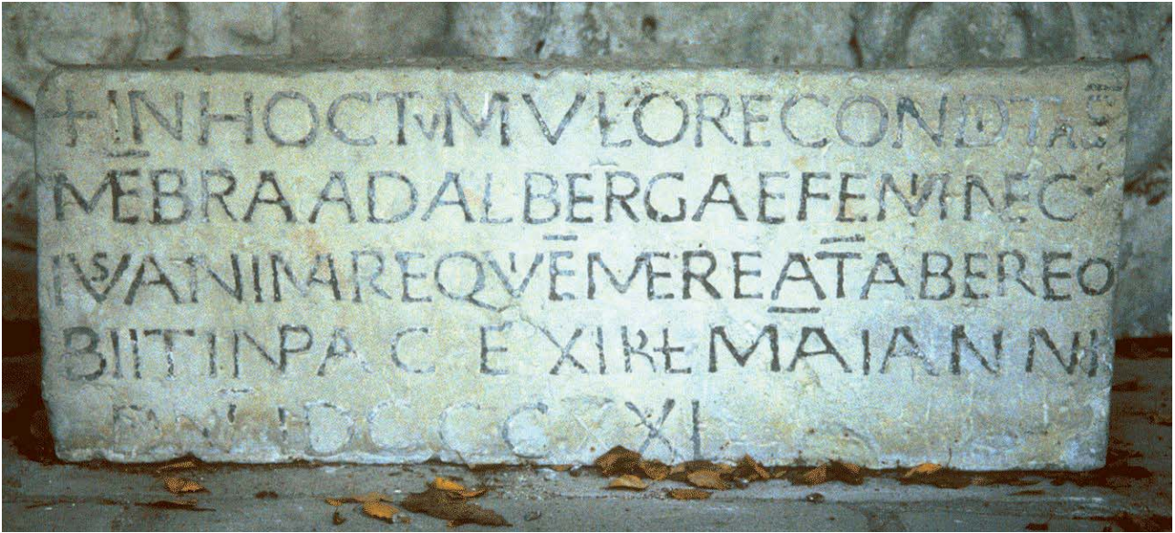
Document 3. Tours, Saint-Martin : épitaphe d'Adalberga.

Cette inscription massive (105 x 38 cm pour une épaisseur de 23 cm), et dont les lettres sont incrustées de plomb, a été découverte en 1829 sur le site de Saint-Martin. Elle a été considérée dans la bibliographie comme caractéristique de la réforme carolingienne de l'écriture, dont elle est un des plus anciens témoins épigraphiques. Le texte, assez simple, rappelle le nom de la défunte (Adalberga), son statut ( femina ), le jour de sa mort (le 21 avril), le tout accompagné d'une prière pour le repos de son âme. Seule, l'indication de l'année, indiquée par le chiffre DCCCXXI, pose problème, correspondant soit à 870 (L plus XX), soit à 830 (L moins XX), plus en accord avec une paléographie courante dans la première moitié du 9 e s. ; si l'on retient cette proposition, l'épitaphe d'Adalberga serait également la plus ancienne inscription conservée à utiliser la datation par année de l'incarnation.