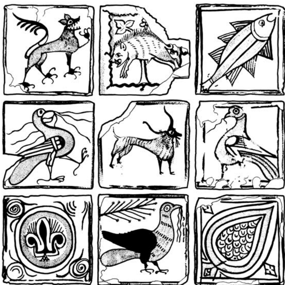
Fig. 2. — Carreaux de Châteauneuf-du-Pape. Musée du Vieil Avignon (noir = brun ; pointillé = vert). Dessins de J. Granier.