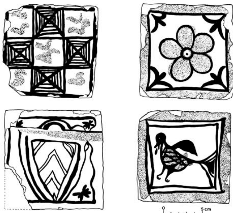
Fig. 3. — Carreaux du Palais des Papes. Musée du Vieil Avignon (noir = brun ; pointillé = vert). Dessins de M.F. Frizet.

oiseaux. Dire que les motifs humains sont encore présents est sans doute excessif si on tient compte de l'unique carreau du studium . Le phénomène le plus marquant qui caractérise ces productions est sans doute l'aspect de ces carreaux. Le détail anatomique y a disparu au profit d'un effet de masse, d'aplats de couleur. Les formes sont alourdis. Parfois, et même souvent, le trait est maladroit, épais, débordant, presque raturé, comme réalisé par un apprenti malhabile... Le dépouillement de la figure, caractère essentiel, apparaît comme une évolution vers une plus grande pureté (malheureusement entachée ici d'une mauvaise maîtrise du trait), vers une simplification de l'effet de masse de l'ensemble du pavement. Est-ce la marque d'une évolution vers des produits d'aspect plus « moderne » ou celle d'une dégénérescence ?