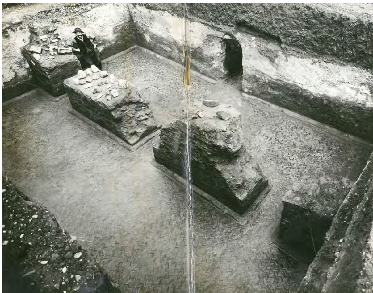
Archives 057, 06, 02, 02. Site non identifié

CARTON 06. Sorbonne, chaire d'archéologie : collections et clichés pour édition.