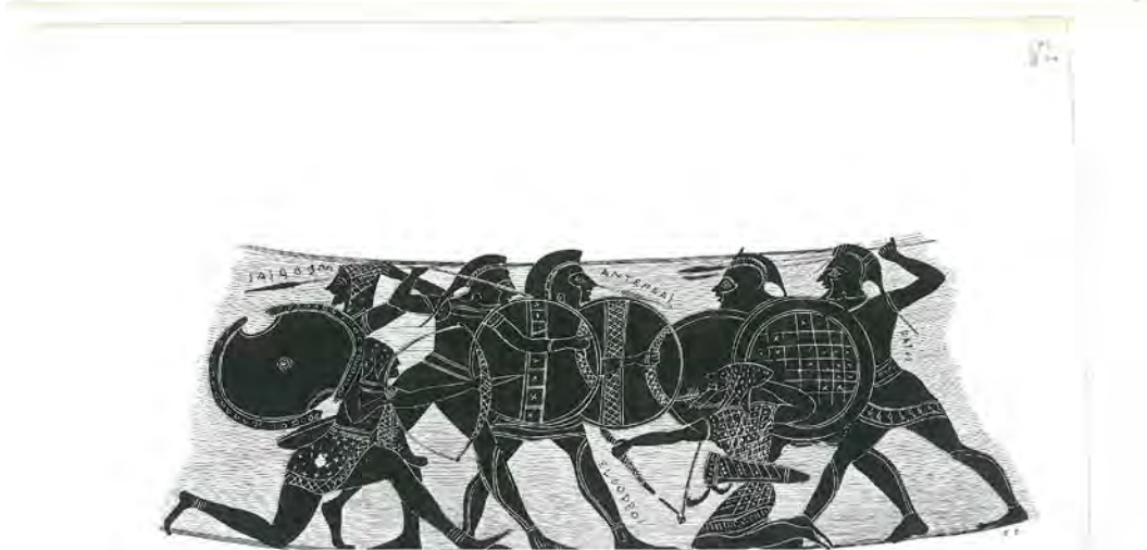
Archives 057, 06, 02, 01. Vases à figures noires : reproductions de diverses figures