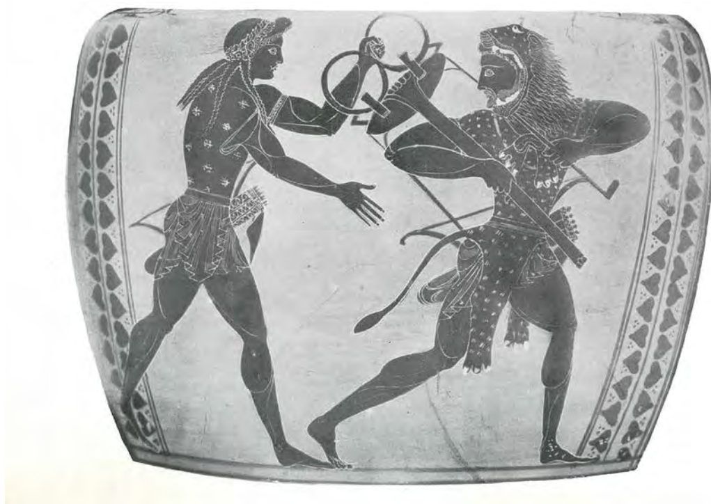
Archives 057, 06, 02, 01. Vase grec du Musée archéologique de Madrid, n°69, pl XII