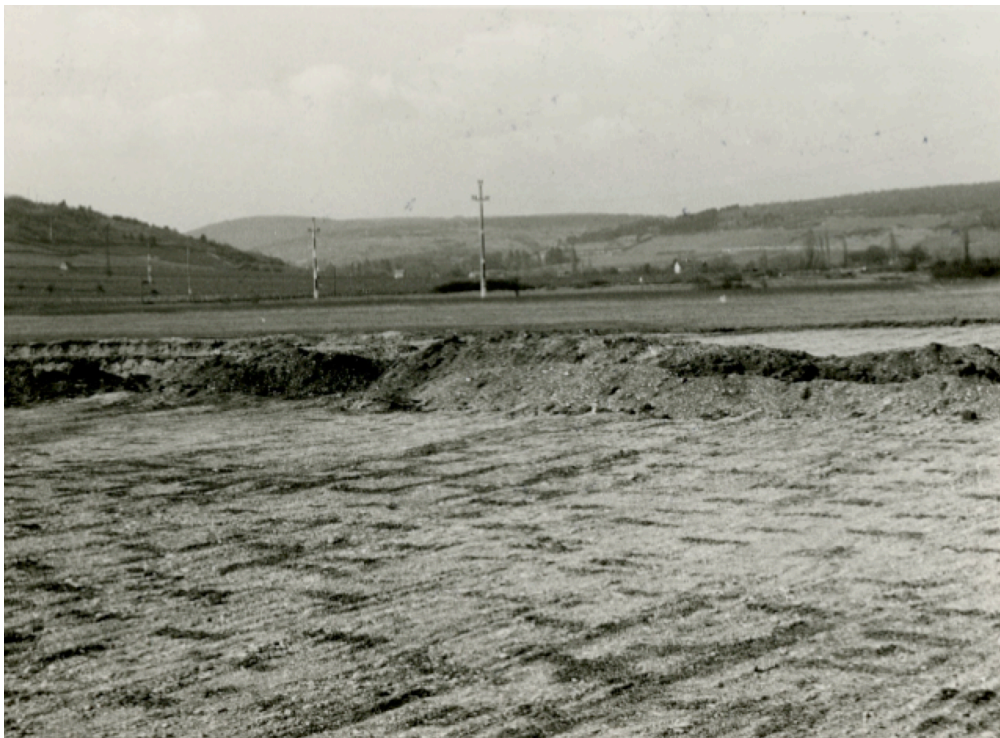
Illustration 3 – Vue des fosses de plantations de vigne de Savigny-Lès-Beaune « La Champagne » en 1962 (cliché L. Perriaux, archives SRA Bourgogne)

A Savigny-Lès-Beaune « La Champagne », des fouilles en 2014 sont venues comme l'aboutissement d'une enquête documentaire motivée par deux photos de 1962 de Lucien Perriaux (naturaliste bourguignon et futur maire de Beaune de 1965 à 1968), conservées au SRA Bourgogne 15 . Ces clichés montrent des traces, difficilement interprétables à l'époque, mais qui aujourd'hui sont tout à fait comparables aux fosses ( alvei ) de plantations de vignobles anciens (romains ou médiévaux) tels que ceux qui sont mis au jour depuis une vingtaine d'années par les archéologues en France 16 .