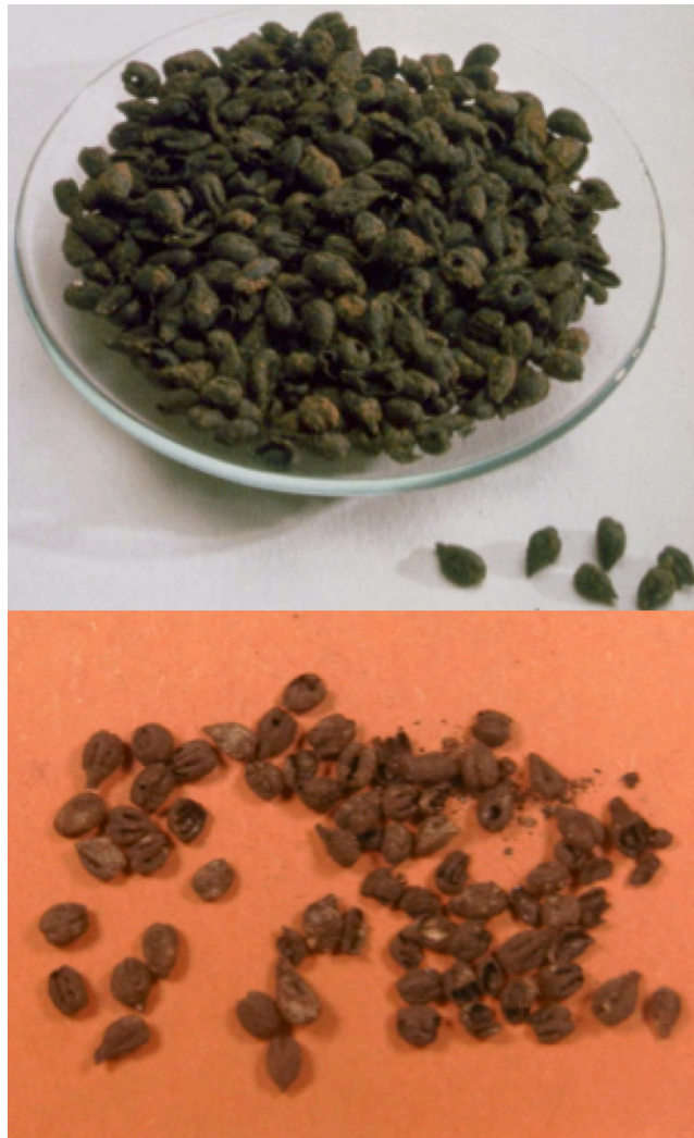
Illustration 1 – Pépins de raisins carbonisés. Haut : villa de Selongey, Côte-d’Or, vers 254 ap. J.C., (© et autorisation musée archéologique de Dijon, cliché F. Perrodin) ; Bas: Villa de Collonges à Lournand, Saône et Loire, après 250 ap. J.-C. cliché D. Barthélémy)

- les outils du vigneron, comme des serpes à tailler la vigne, les serpettes de vendangeurs largement disséminées dans les anciennes régions viticoles et en d’assez nombreux lieux de Bourgogne (Roilly, Beaune, Vertault etc.) avec la réserve de leur fonction polyvalente et de leur dissémination large car ce sont des objets transportables.