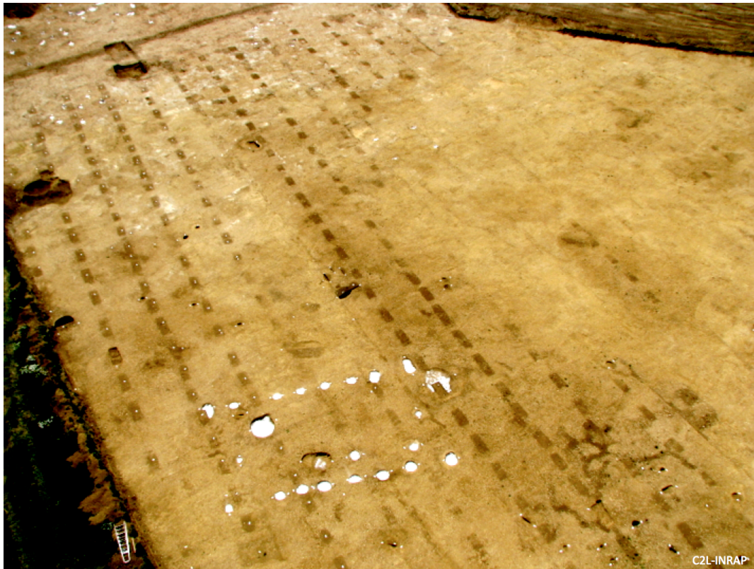
Illustration 2 – Vue aérienne des rangs de fosses de plantations de la vigne gallo-romaine de Gevrey-Chambertin

Cette métrique rigoureuse est peu parlante dans nos unités de mesures, mais quand on l'exprime en pieds romains (1 pied = 29,7 cm), les fosses étudiées ont des dimensions en chiffres ronds: longueur \approx 3 à 4 pieds ; largeur \approx 2 pieds ; espacement \approx 3-4 pieds ; distance entre les rangs \approx 10 pieds. C'est un indice pour interpréter cette plantation comme un vignoble d'époque romaine car on retrouve ces dimensions dans les recommandations de Columelle au 1 er s. ap. J.-C.. La présence de deux creusements par fosse, séparées par un « bourrelet médian » est une modalité inédite dans les pratiques agricoles modernes et n'est pas connue à l'époque médiévale. C'est par contre un mode antique de plantation de la vigne à plusieurs plants par fosse, préconisé par Pline l'Ancien (type alveus , Histoire Naturelle , XVII) et Columelle ( De l'Agriculture , liv. 3 ème , XV). Ce dernier recommande pour les jeunes plants de « les arranger en les courbant de façon que les racines des deux marcottes qui sont dans la même fosse ne s'entrelacent pas mutuellement, ce qui sera facile d'empêcher en disposant au fond des fosses, transversalement et par le milieu, quelques pierres, dont chacune n'excède pas le poids de cinq livres », un dispositif qui peut correspondre aux bourrelets médians observés au fond des fosses.