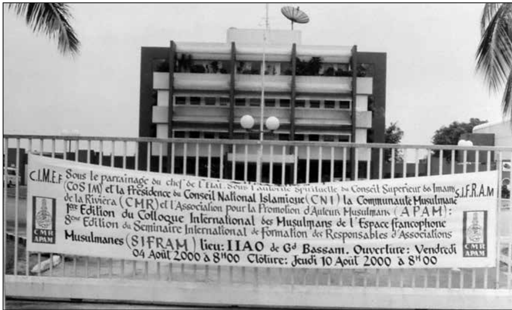
Banderole du premier CIMEF qui s'est tenu en Côte d'Ivoire en 2000