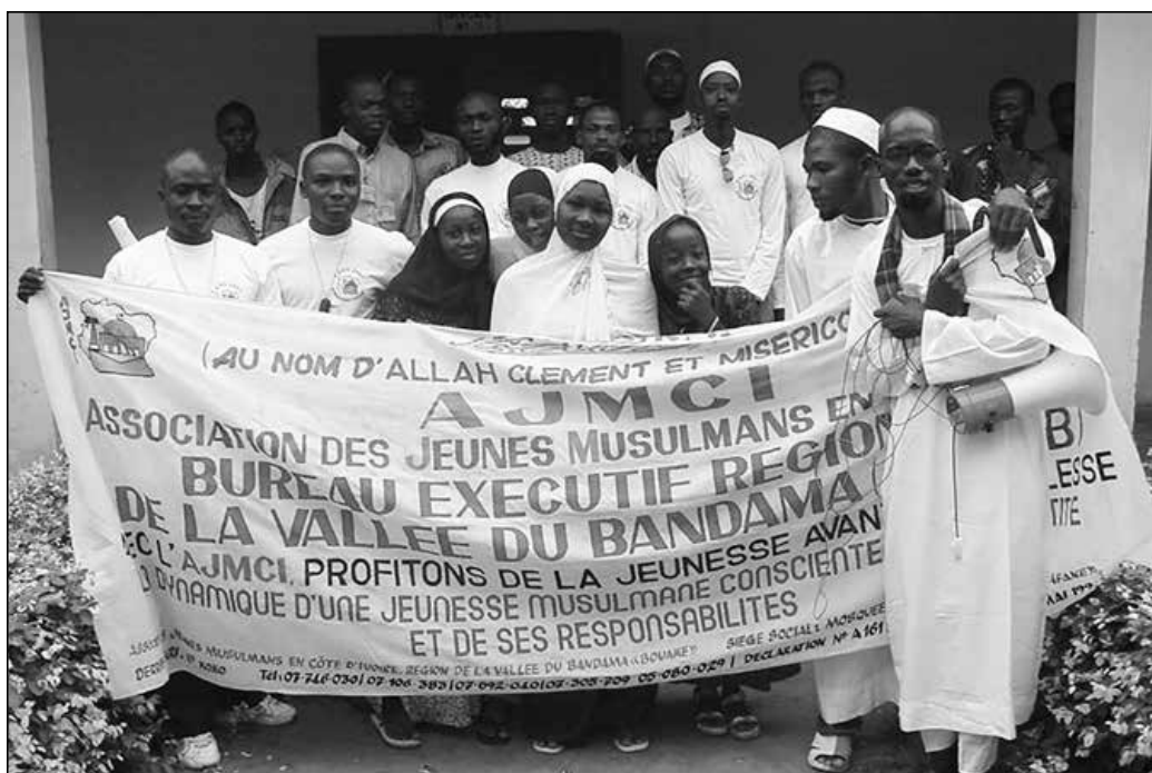
Banderole d'une section régionale de l'AJMCI, 2007

révélation. Ainsi furent-ils aussi initiés modestement à la pratique d'une certaine modernité, contrastant fortement avec leurs habitus traditionnels. Par la suite, cette expérience se trouvant reprise par d'autres régions, l'AJMCI décida d'élargir sa base au plan national pour devenir une association plus inclusive. Initialement centrée sur la jeunesse comme son sigle l'indique, l'AJMCI se donna pour nouvelle ambition de devenir « une association qui prend en compte le militant du berceau à la tombe ». À l'appui des acquis de l'association, l'objectif consiste à propager son savoir-être et son savoir-faire à travers toute la Côte d'Ivoire.