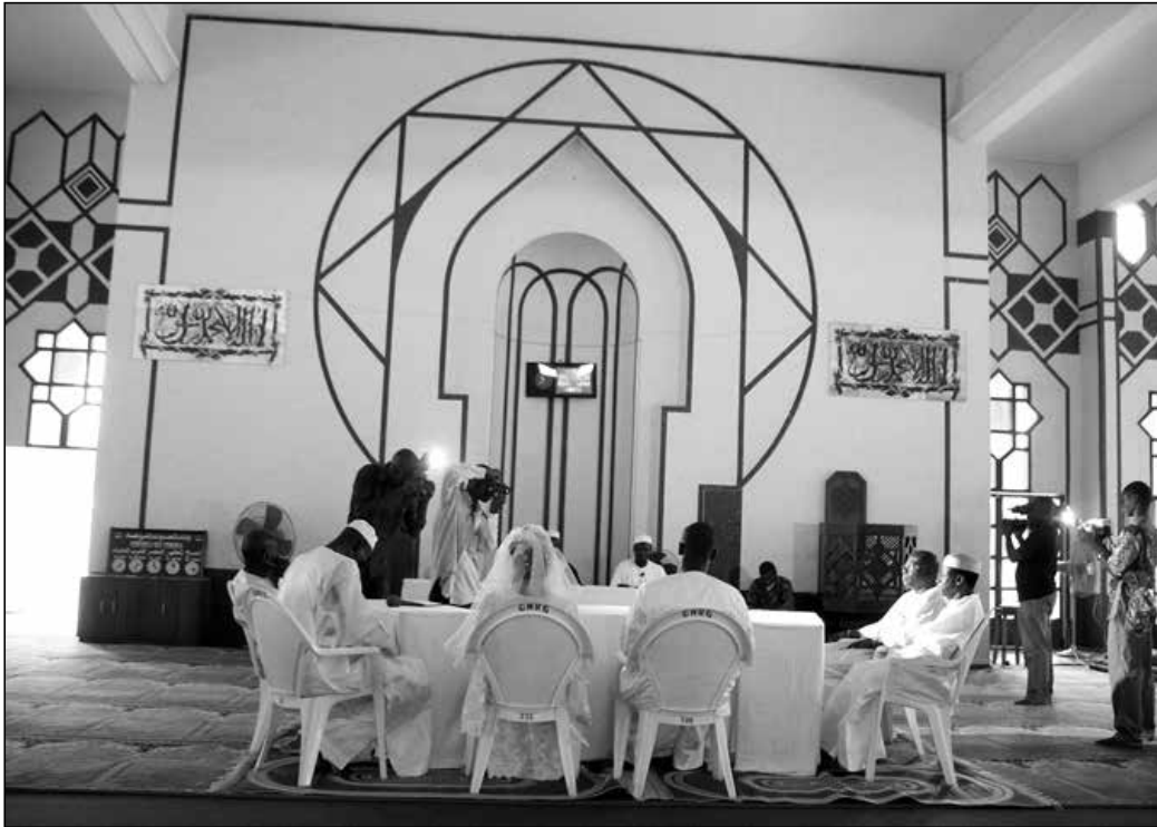
Mariage musulman à la mosquée de la Riviera Golf, 2007

Les futurs époux sont en général de jeunes couples monogames 18 issus de familles aisées. La femme est présente en robe de mariée à l'occidentale sous un tulle blanc. L'homme et la femme écoutent l'imam et d'autres officiants leur parler – en français – de leurs obligations réciproques puis ils attestent à tour de rôle de leur libre engagement dans le mariage. Leurs témoins certifient leur bonne moralité et, ensemble, ils apposent des signatures sur des documents. Famille et amis assistent à la cérémonie sur des chaises disposées comme des bancs d'église, femmes d'un côté, hommes de l'autre. Photographes et cameramen immortalisent l'événement.