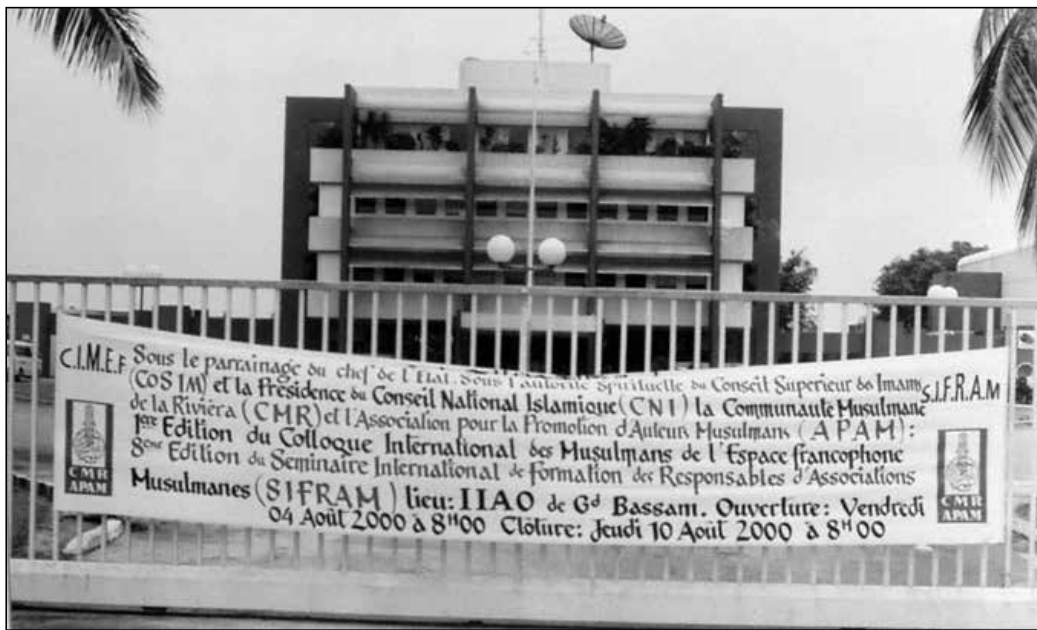
Banderole du premier CIMEF qui s'est tenu en Côte d'Ivoire en 2000