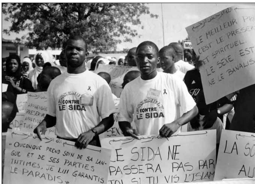
Pancartes de la première campagne islamique contre la pandémie du VIH-Sida, 1998

que locale. Au moment de la création de la fédération du Conseil national islamique (CNI) en 1993 – structure importante s'il en fut alors - le choix du président fut même assorti d'une clause précisant qu'il devait être francophone. Même les leaders du mouvement dit wahhabite/salafiste/sunnite, arabophones réputés, mirent désormais un point d'honneur à recourir au français.