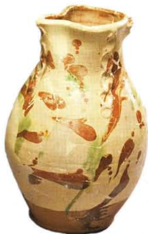
2 : Cruche de forme haute à cordon digité, panse ovoïde, anse verticale rubanée, bec pincé, fond plat à talon (ht. 32 cm). Glaçure intérieure monochrome sur engobe et marbrures d'engobe à l'extérieur : atelier de Fréjus.