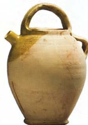
4 : Cruche de forme ovoïde (ht. 27,5 cm), lèvres arrondies, anse de panier et petite anse verticale attachée sur la lèvre à l'opposé du bec tubulaire, fond plat : atelier de Fréjus.