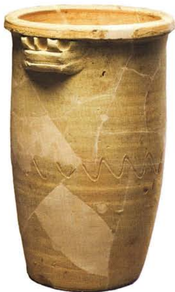
5 : Pot à conserve – Panse haute et cylindrique (ht. 32 cm), lèvre en bourrelet, deux anses horizontales digitées, fond plat : atelier de Fréjus.