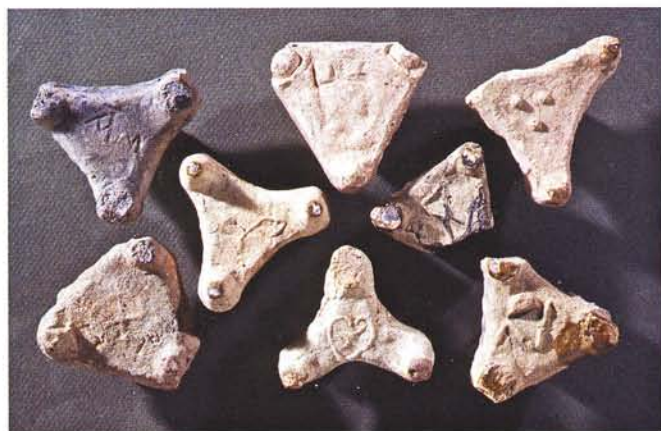
16 : Pernettes tripodes utilisées pour séparer les vaisselles dans le four. Ces artifices de cuisson, moulés, sont marqués par les artisans de signes énigmatiques, svastika, globules, écu ou plus clairement par des initiales (long. 6 cm).