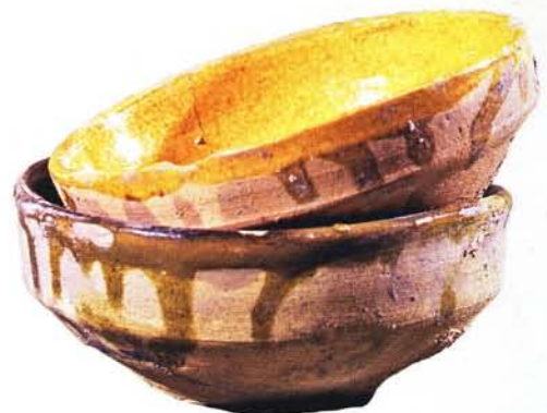
37 : Bols déformés, engobe et glaçure jaune et verdâtre (Ø 12,5 à 14 cm).