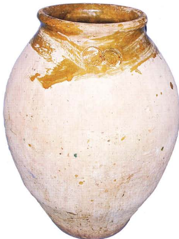
31 : Jarre, estampilles à l'écu de France et chaîne du Saint-Esprit, début XVII e s. Musée d'histoire locale de Fréjus (ht. 60 cm).