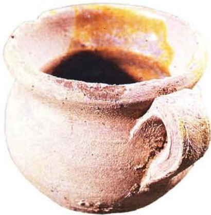
33 : Petit pot à une anse pour réchauffer les liquides, glaçure jaune à l'intérieur (diam. à l'ouverture 7 cm, ht. 6 cm).