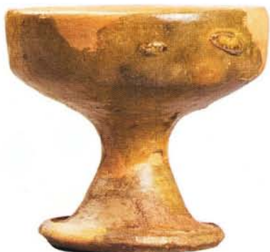
34 : Salière sur pied, engobe et glaçure jaune (ht. 7,5 cm, diam. à l'ouverture 8,2 cm).