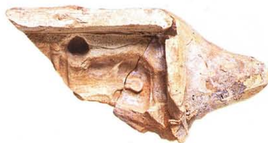
17 : Moule en terre cuite muni d'un tenon pour la confection d'une petite colonnette (long. conservée 15 cm, larg. 7,5cm).