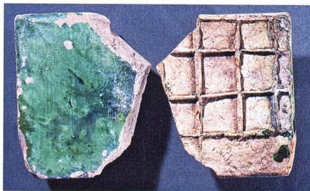
29 : Carreau de pavement engobé et glaçuré en vert, quadrillage au revers (long. 11,2 cm, ép. 2 cm).