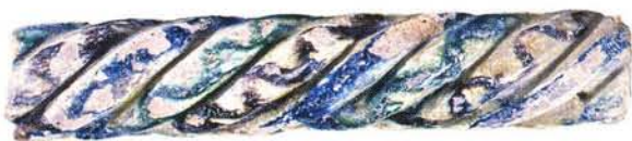
20 : Colonnette torsadée, recouverte d'engobe, et peinte en vert et brun sous glaçure, encoches au revers (long. conservée 29 cm, larg. 5,5 cm).