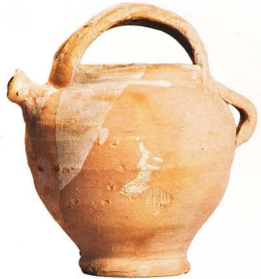
35 : Pot à anse de panier et bec tubulaire, engobe et glaçure non cuite (ht. 18 cm).