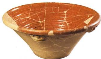
8 : Jatte à anse – Grande forme tronconique (Ø 51 cm), lèvre en bourrelet épaissi et arrondi, quatre anses digitées, fond plat. Glaçure intérieure sur engobe : atelier de Fréjus.