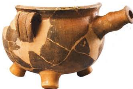
10 : Marmite à queue de forme globulaire (Ø 23 cm), lèvre inclinée, trois anses et une queue de préhension, fond rond muni de trois pieds : atelier de Biot-Vallauris.