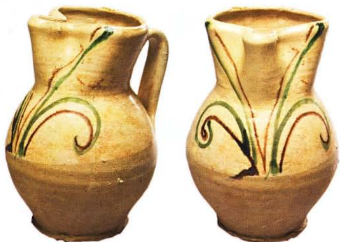
38 : Cruche à bec trilobé et décor peint en vert et brun sur engobe et sous glaçure (ht. 22,5 cm).