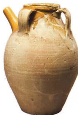
3 : Cruches de forme haute ovoïde (ht. 34 à 39 cm), col court, lèvres épaissies, bec tubulaire, trois anses verticales, fond plat. Glaçure intérieure et extérieure en bavoire autour du bec : atelier de Fréjus.