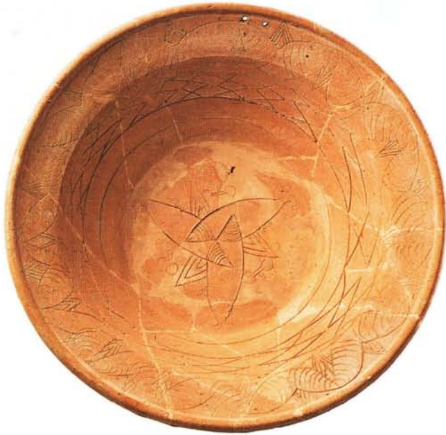
32 : Grand plat de cérémonie, à marli percé de deux trous de suspension. Décor incisé géométrique encadrant trois poissons entrelacés (Ø 42 cm).