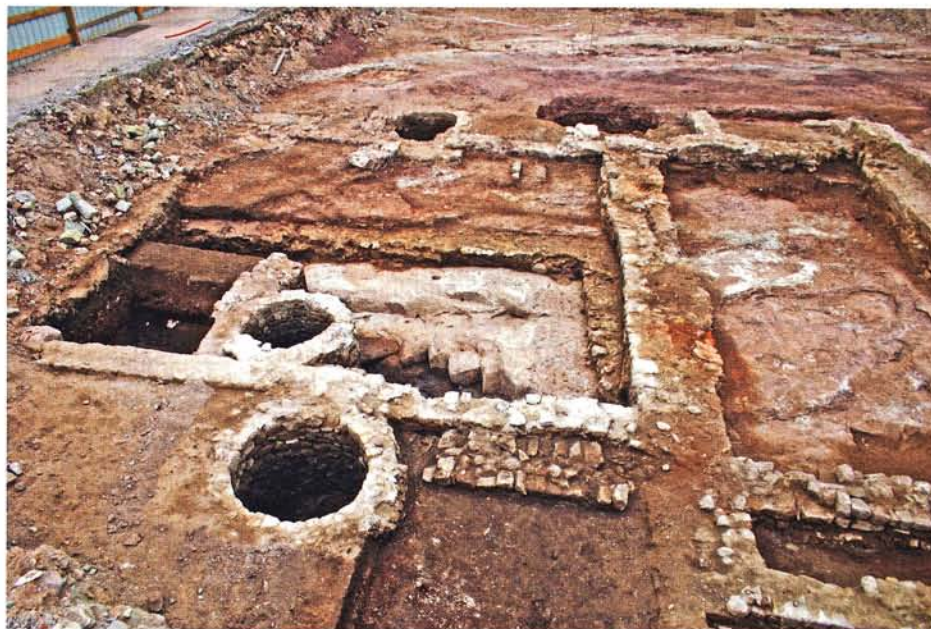
Les puits du quartier Saint-Joseph

l'ajout de l'atelier et ses aménagements successifs, resta la même jusqu'à la construction du rempart moderne.