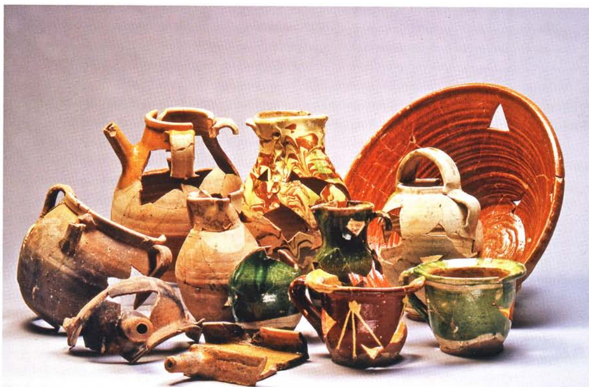
Céramiques issues du puits dépotoir.