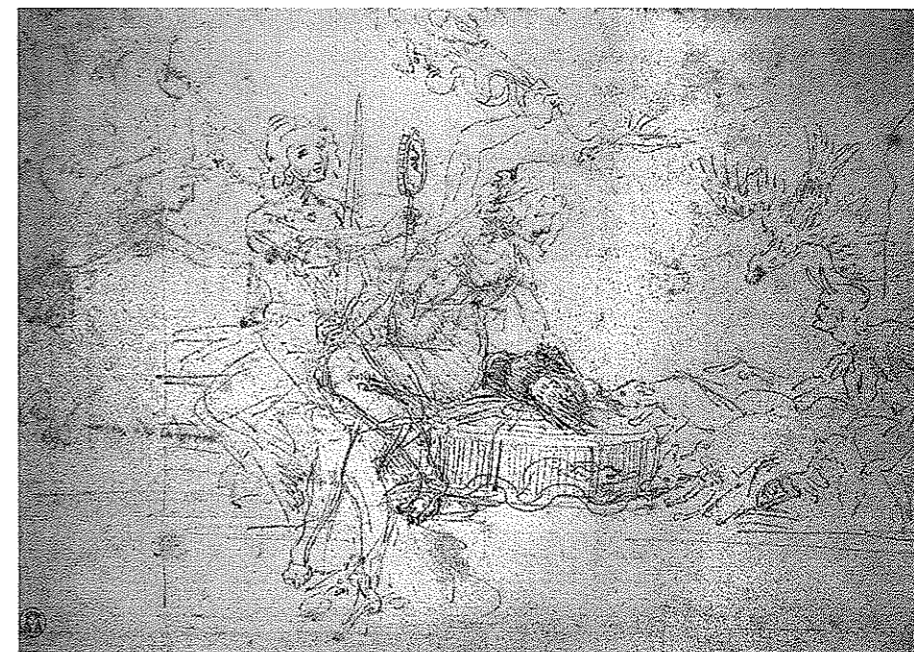
Fig. 1. Allegoria, prudenza e giustizia, Oxford.

Temperanza), sia nella particolare preferenza per essa, che Ludovico (o chi per lui) dovette evidentemente trasmettere in ispirazione a Leonardo: tutti i più significativi attributi simbolici sforzeschi, infatti, sono retti dalla sola Prudenza, che se ne serve come di armi per difendere il gallaccio-Galeazzo 20 . La lettura complessiva dell'opera, dunque, suggerisce di riconoscerci una trasposizione allegorica del governo tutelare del Moro, che si voleva presentare come giusto e prudente, a fronte di probabili (e plausibili) voci di dissenso, suscitate non tanto ex parte populi (che, anzi, esprimeva simpatia per il reggente de facto ) 21 , quanto nell'ambito dei sodali del nipote e, soprattutto, a