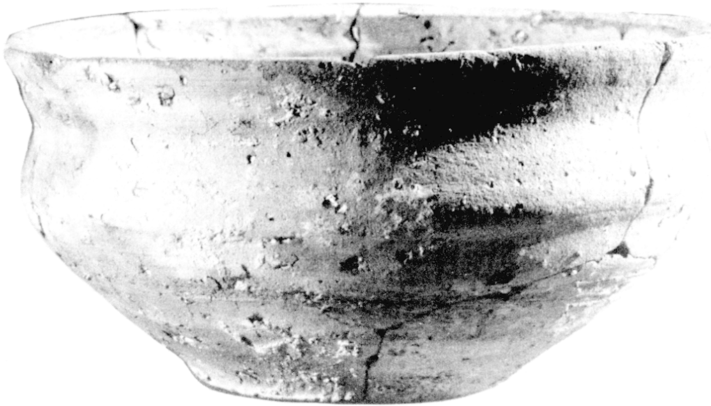
Fig. 2 : Creuset

récente conforte cette idée de datation postérieure au V e siècle : sur le site des fouilles de la Bourse à Marseille, un bec de pégau comparable a été découvert dans un niveau postérieur au milieu du VI e siècle ; en outre, la pâte de ce fragment, du type des céramiques sigillées grises, ne permet pas de le situer dans une période avancée du moyen âge (16). La distinction bien nette du bec tubulaire oblique avec le reste de la pièce et le type d'attache qui débordent sur l'ourlet du récipient semblent être les principaux critères des premiers pégaus comme l'avait observé justement S. Gagnière dans sa classification du pégau (17).