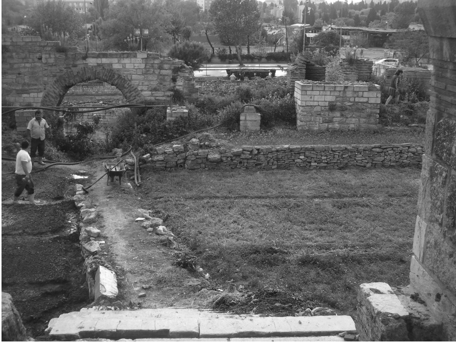
Figure 5 Travail d'adduction d'eau sur une parcelle près de Belgradkapi. Water supply works near Belgradkapi.

Cette extension avait déjà eu pour effet de limiter les autres usages, et en particulier les habitats précaires, relevant du premier type de régulation, notamment entre Silivrikapi et Belgradkapi. En dépit des apparences, ces habitats nichés dans les périboles et les tours étaient plutôt pourvoyeurs de contrôle social interne à la muraille : la préservation de leur emprise mais plus encore leur voisinage avec d'autres usages passaient la plupart du temps par des dispositifs matériels et des rituels de coprésence facilitateurs et assez bien appropriés par les usagers. Chaque usage se voyait reconnu un périmètre de sécurité rarement transgressé – ceci dans l'intérêt bien compris de tous. Ces voisinages tendent aujourd'hui à diminuer. Par ailleurs, les transformations mentionnées sur les autres zones (baisse de la diversité des usages informels en certains endroits, déplacement ou concentration d'usages plus transgressifs) ont également contribué à renforcer la sécurisation des portions cultivées – que cela corresponde ou non à des risques de vol réellement plus élevés.