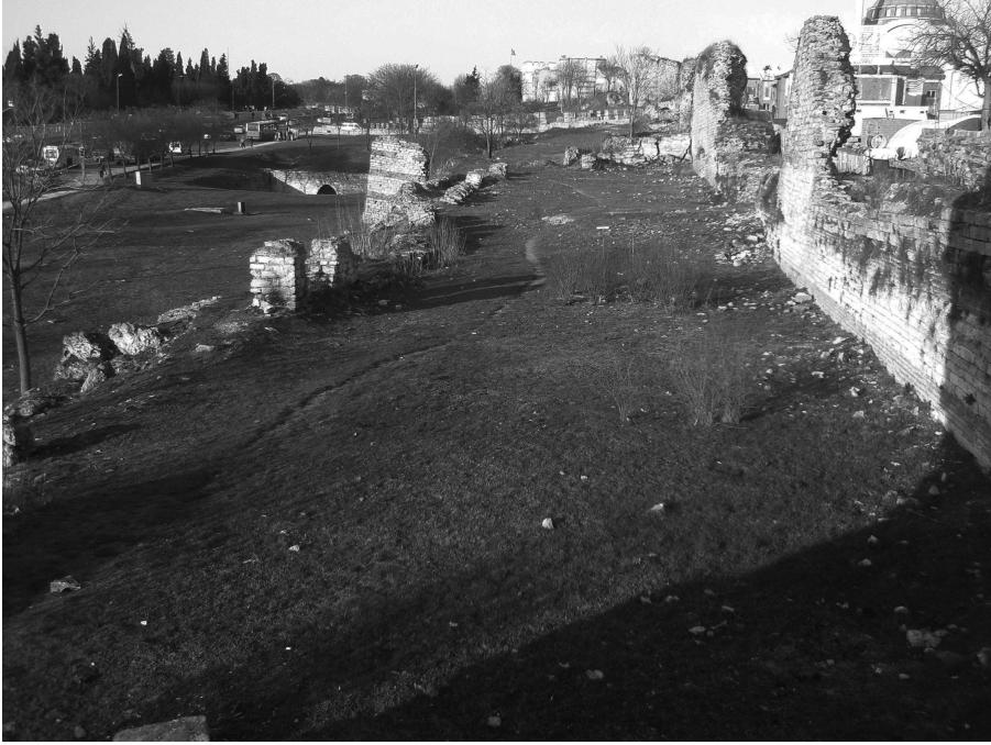
Figure 4 Portion de la muraille qui longe le quartier de Sulukule, depuis la trouée d'Ulubatlı jusqu'à Edirnekapi.

Section of the walls along Sulukule, from Ulubatlı junction to Edirnekapi.