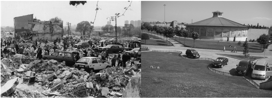
Figure 2 Esplanade devant Topkapı pendant la période de latence en 2001 puis en 2013. Esplanade in front of Topkapı in 2001 and in 2013.

Cette indécision apparente cache un nœud stable de compromis autour de la présence de l'informel. Ici en effet se joue un épisode important des processus de régulation des tensions urbaines, sociales et économiques de la ville. En ouvrant un territoire de recomposition étendu dans l'espace et le temps, cette phase de transition permet à des modes de régulation de prendre place et de se stabiliser. L'indécision du lieu favorise les arrangements et en fait un laboratoire des compromis pratiques sur le terrain. Les vendeurs de rue négocient durant cette période leurs positions avec des policiers, les usages plus labiles ou transgressifs se calent dans les parties plus reculées. La municipalité est moins regardante, sur un lieu qui de toute façon est promis à un autre avenir.