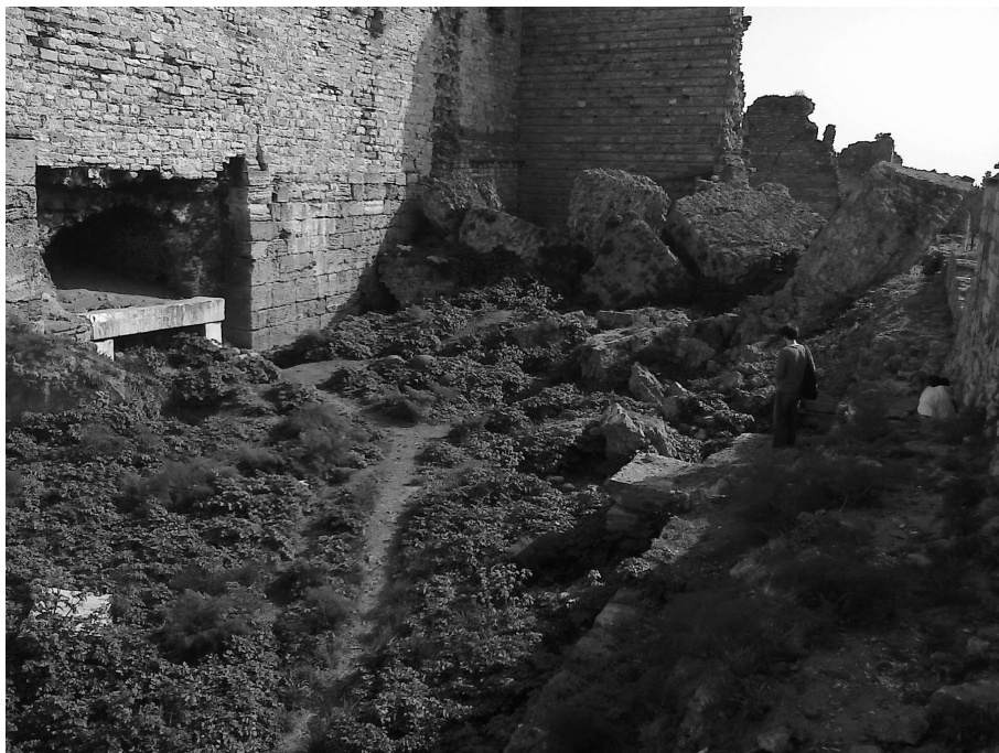
Figure 3 Passages à la Porte de Romanos. Movements at Romanos Gate.

Après une courte portion clôturée et intégrée à un jardin de thé municipal, on parvient à la troisième portion. Entre la porte de Topkapı et la trouée d'Ulubathı, le terrain descend sur environ trois cents mètres. La muraille est bordée côté extérieur par de bruyants échangeurs routiers, en partie souterrains. Côté intérieur, une ruelle longe le rempart. Plusieurs passages de part et d'autre donnent accès à une section intérieure de la muraille qui a longtemps accueilli des déambulations mais aussi tout un spectre de pratiques banales : repos, repas, discussions... Depuis deux ans, la situation évolue : les pratiques informelles plus quotidiennes ont cédé la place aux errances. La fréquentation du lieu est plus dense, et exclusivement masculine. En dehors des habitués du lieu, qui tendent à imposer leur emprise, les modes de coprésence sont basés sur une oscillation entre évitement et contact : les regards se font insistants, les approches ne tardent pas et les contacts débouchent sur des demandes d'argent, de cigarettes, qui peuvent tendre vers le racket dans certains cas. La présence d'une femme sur les lieux attire très vite plusieurs individus et amène des harcèlements.