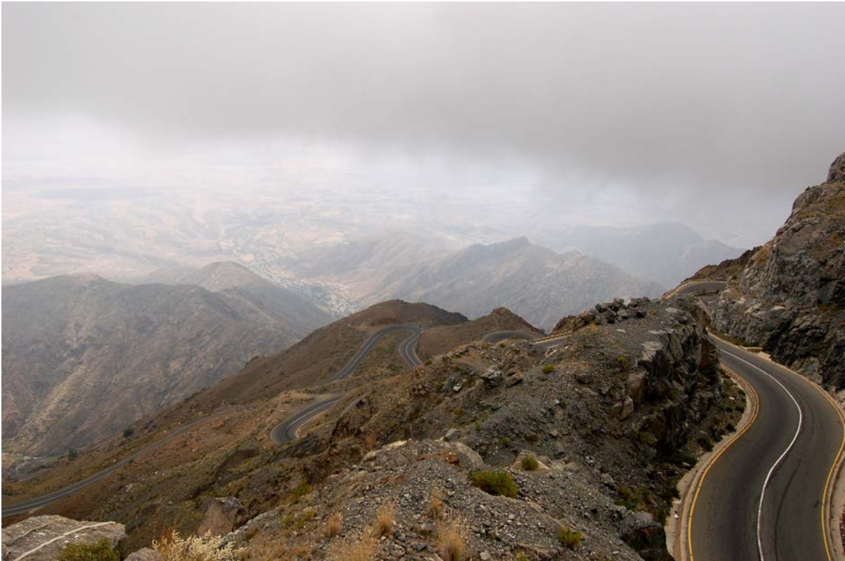
Escarpement de Lawdar.