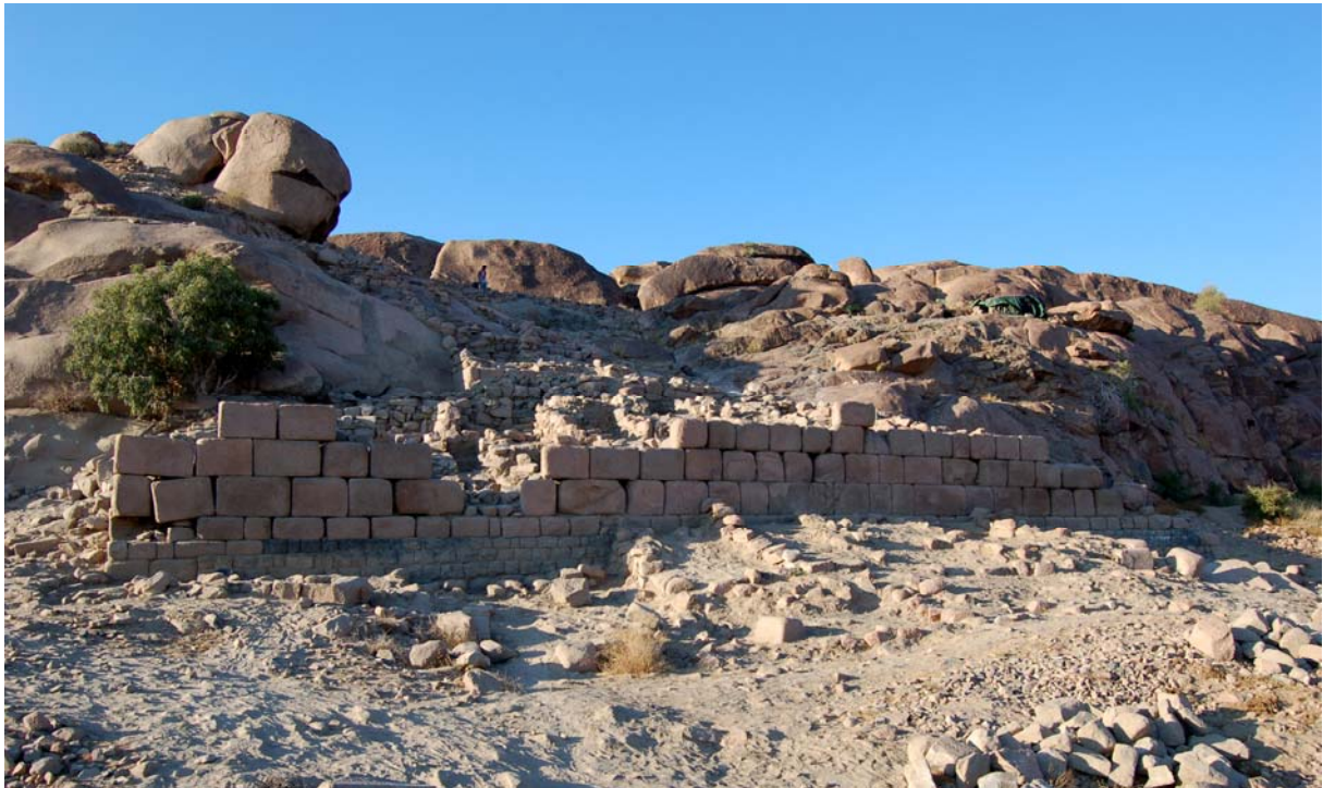
Hasî. Mur de terrasse du Bâtiment A.