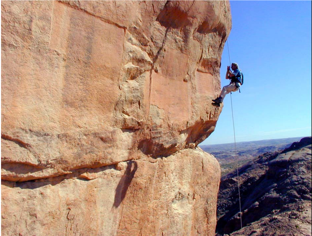
Al-Mi'sâl. Relevé photographique des inscriptions du sanctuaire de Shams, gravée sur une paroi rocheuse à dix mètres du sol.