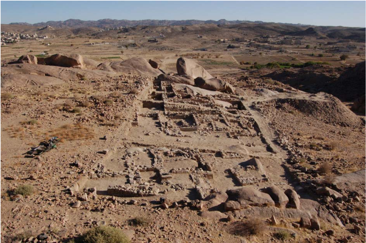
Hasî. Vue des maisons du secteur C.