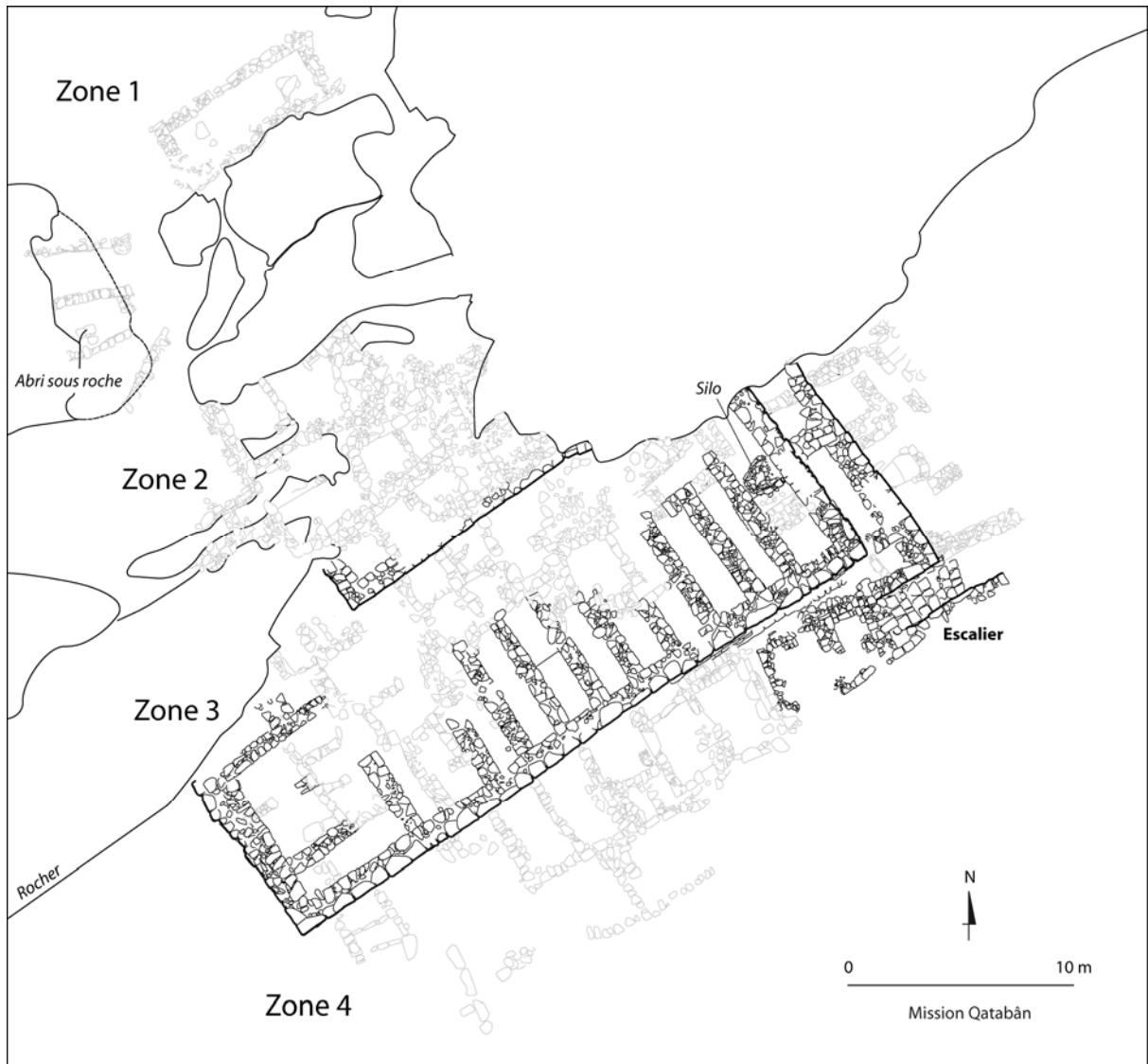
Hasî. Plan du secteur A – en noir, le Bâtiment A.