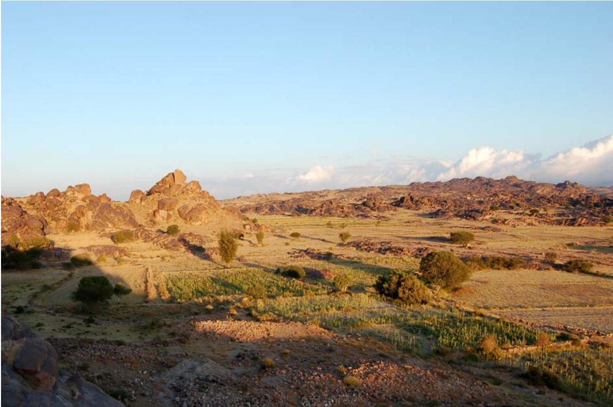
Ruines de Hasî et de ses environs.