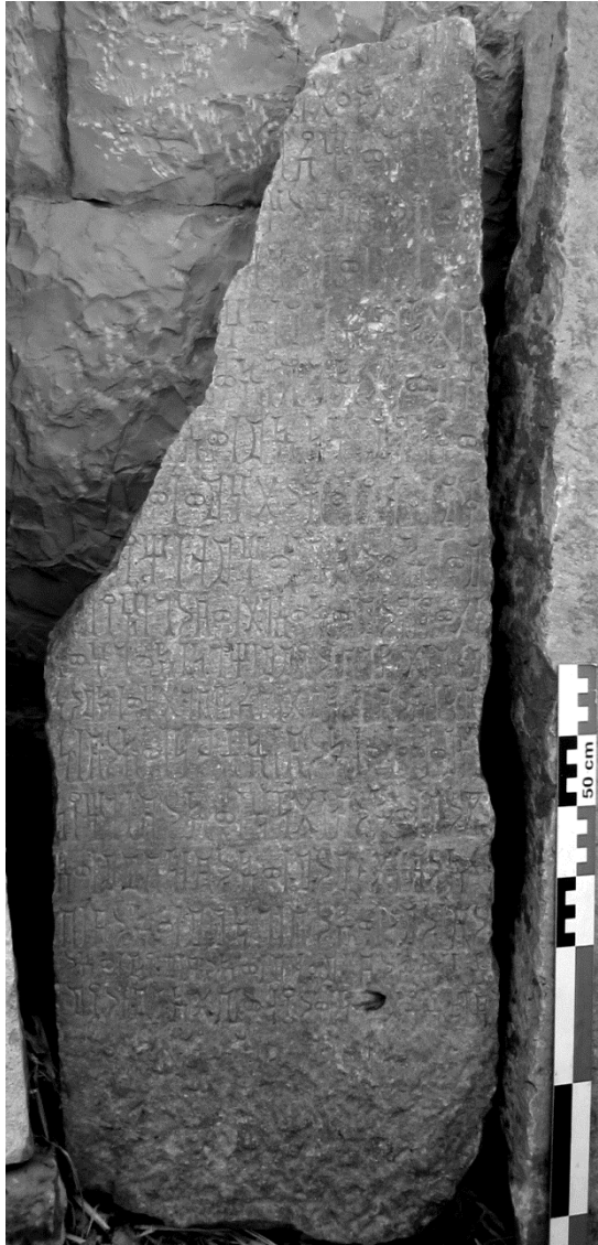
Figure 2 : Inscription Jabal Riyām 2006-17.