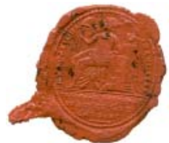
Cachet du tribunal criminel de Lot-et-Garonne (100 J 1)