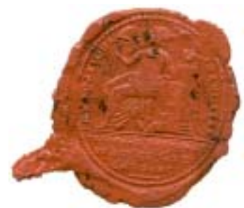
Cachet du tribunal criminel de Lot-et-Garonne (100 J 1)