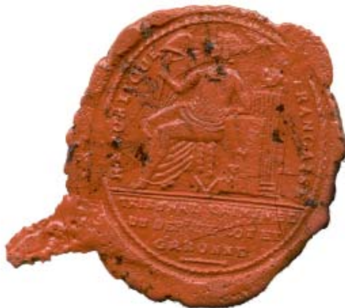
Cachet du tribunal criminel de Lot-et-Garonne, A.D. de Lot-et-Garonne, 100 J 1.