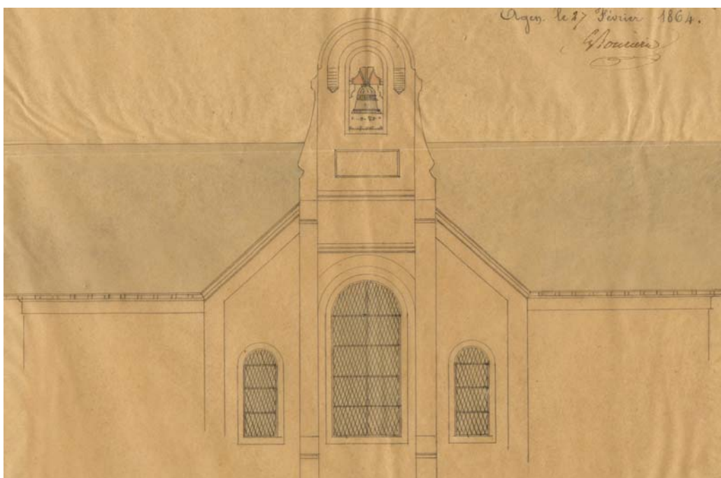
Le campanile de la prison d'Agen, 1864, A.D. de Lot-et-Garonne, 4 N plan 199.

Ces documents graphiques illustrent divers travaux publics et privés à Agen et dans le département de Lot-et-Garonne.