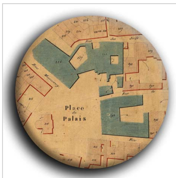
Extrait plan cadastral napoléonien d'Agen, 1845.

Au début de la Révolution française, le nombre de détenus est important. On en décompte 150 en avril 1792, presque 200 l'année suivante. Le nombre moyen de détenus s'établit ensuite à 130. Les prisonniers sont alors répartis de la manière suivante : les criminels sont confinés dans les cachots du sous-sol, les prévenus et condamnés occupent les premier et second étages. L'appropriation des bâtiments à usage de détention est lente et laisse encore à désirer en 1801. La prison ne possède ni préau ni grande cour et les détenus n'y travaillent pas. Des murs sont salpêtrés, des boiseries pourrissent. Il est question, déjà, d'agrandir l'établissement par l'achat de la maison Brimont, et ce n'est qu'en 1820 que la prison est à peu près restaurée.