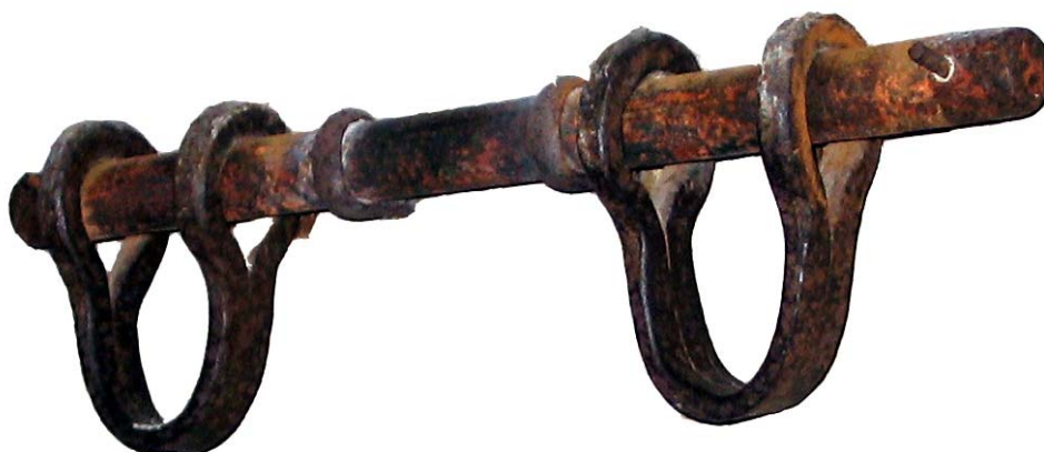
Fers, Musée des Beaux-Arts d'Agen