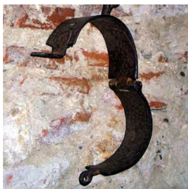
Fers, Musée d'Agen