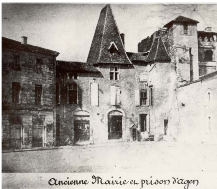
Ancienne mairie et prison d'Agen, A.D. de Lot-et-Garonne, 5 Fi 30.