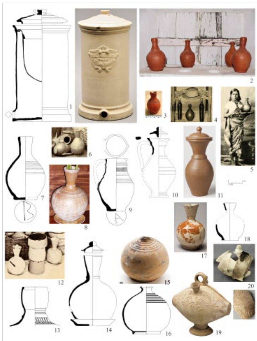
fig. 5 – n. 1, filtre à eau Mallié; n. 2, étagère à carafes, Martinique; n. 3, jouet en terre locale; nn. 4-6, cartes postales, carafes, Martinique; nn. 7-9, carafes locales; nn. 10-11, SÈVRES 1874 et 1843 (M. Beck-Coppola, Musée de Sèvres RMN); n. 12, carte postale, gargoulettes de Provence; nn. 13-18, gargoulettes de Provence; n. 20, cantir d'Espagne.

petit destiné «à la servante du curé» ou aux enfants (fig. 3, n. 5). Ils forment un couple que les archives mentionnent fréquemment, voire systématiquement avec une cuvette de terre nommée le plus souvent «terrine» et «tian» en Provence. Ces récipients sont des bassines aux usages multiples produites à Saint-Zacharie et Aubagne. Elles sont à l'occasion utilisées comme bidet avec monture de bois ou cuvette pour la toilette (fig. 4, nn. 6-7). On peut considérer que pot de chambre et terrine en terre vernissée sont un particularisme d'une communauté antillaise française. Les archives rapportent fréquemment l'existence de «terrines de terre vernissée» dont il n'est pas douteux qu'elles étaient articles de Provence. La succession de la Veuve Vergue à Fort-Royal en 1788 comprend: «une terrine de terre vernissée» 10 . De modestes marchands de la même ville en 1791 tiennent en magasin: «vingt quatre terrines de terre vernissée» 11 .