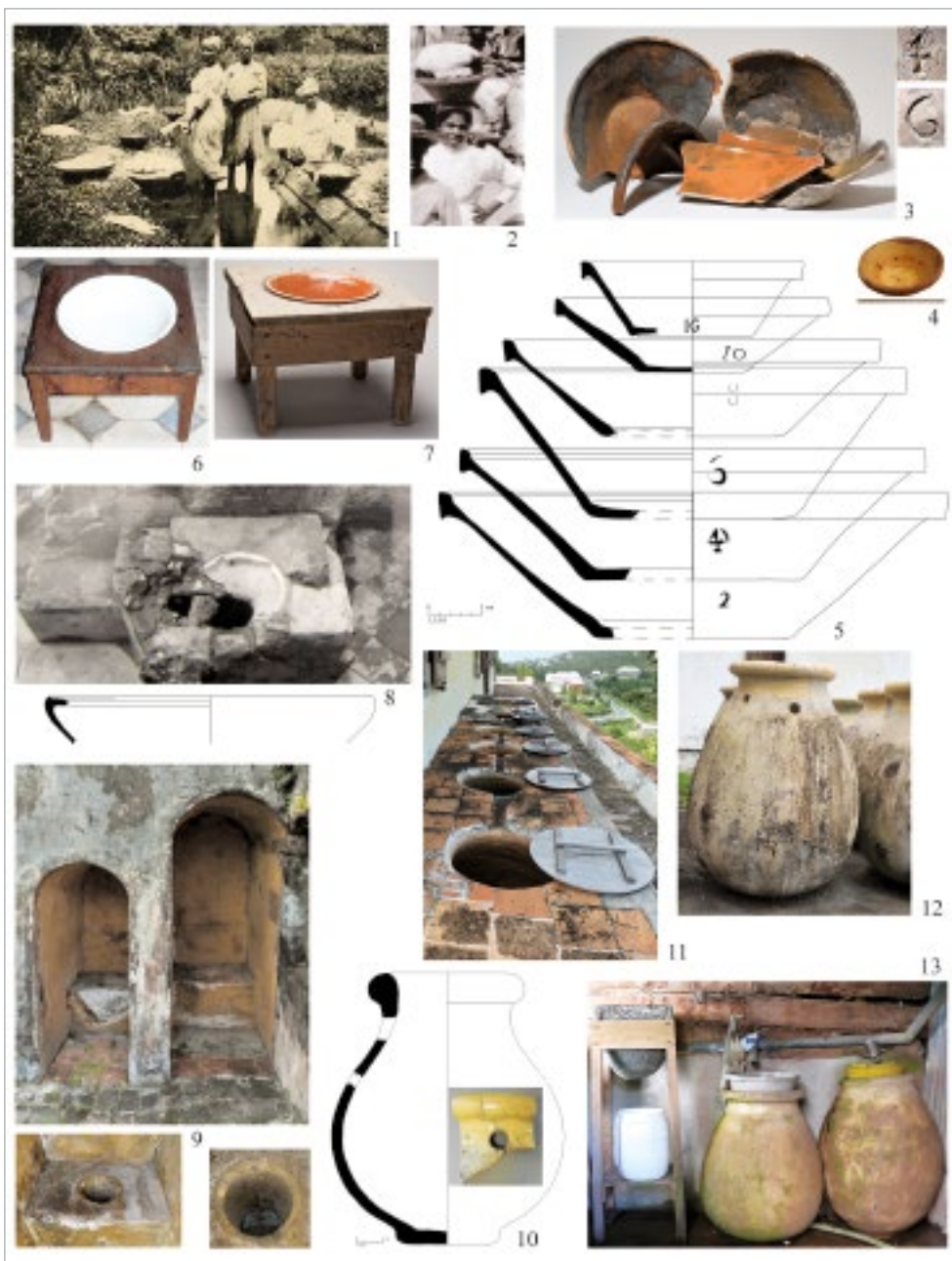
fig. 4 – nn. 1-2, cartes postales, lessiveuses en Guadeloupe et marché en Martinique; nn. 3, 5, bassins en terre vernissée de Provence; n. 4, jouet; nn. 6-7, bassins dans leur meuble; n. 8, cuvette anglaise, château Perrinelle, St-Pierre (S. Veuve SRA); n. 9, latrines, Maison Coloniale de Santé, St-Pierre; nn. 10 et 12, jarres de Biot percées; n. 11, case à eau, Martinique; n. 13, jarres de Biot et pierre à filtre, Guadeloupe.

les meubles de l'académie de jeux citée ci-dessus, l'on dénombre «3 pots de chambre & un blanc», dans le vestibule et, logiquement, dans la «Garde robe», «3 pots de chambres avec leurs pieds». Il n'est pas interdit de penser que le pot blanc est une faïence, et les trois sans indication, de la terre vernissée, quant aux trois avec pied, ils font référence à un dispositif de surélévation assez commun. Le pot d'aisance en faïence est un objet courant et il n'est pas rare d'en trouver en grand nombre dans les maisons riches. En 1791, les Assier de Montrose ont «Dix pots de chambre de fayence» (cf. note 7). Très rarement, l'origine de cette dernière est identifiée mais la Veuve Monval, à Sainte-Marie, en 1794, possède «Un pot de chambre de faillance de Normandie» (cf. note 5).