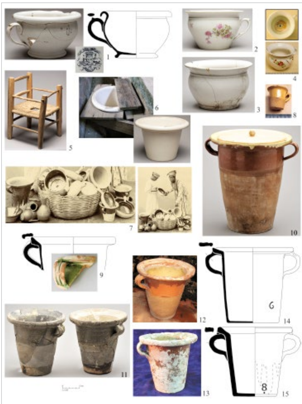
fig. 3 – n. 1, vase de nuit en faïence fine, Bordeaux; nn. 2-3, vases de nuit en porcelaine; n. 4, jouet en porcelaine; n. 5, chaise percée d'enfant; n. 6, seau en faïence fine dans son meuble; n. 7, carte postale, marchande de terraille; n. 8, jouet en terre vernissée; nn. 9-15, pots de chambre en terre vernissée de Provence.

Il ne semble donc pas que les hommes des colonies aient eu des pratiques qui diffèrent en quoi que ce soit de celles de leur contemporains métropolitains.