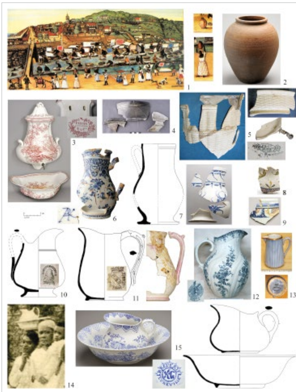
fig. 1 – n. 1, Bassot 1765 (BEUZE 1990); n. 2, jarre locale; nn. 3-5, fontaines et bassins en faïence fine, Sarreguemines et Creil-Montereau; n. 6, pot en faïence, Delft vers 1700. (CASAGRANDE 2010); nn. 7-9, pots en faïence, Rouen XVIIIe s.; nn. 10-12, pots en faïence fine, St-Amand et Sarreguemines; n. 13, jouet en porcelaine; n. 14, carte postale, Hôpital de Fort-de-France; n. 15, pot et cuvette en faïence fine, Lunéville.

dans les collections archéologiques de la Place Royale, de rares fragments de fontaines en faïence peintes sont comptabilisés dans trois contextes de maisons du XVIIIe siècle (GENÉT 1980, pl. 20-21). Il en est de même à Paris, où les fouilles en n'ont semble-t-il pas livré, bien que les manufactures de Rouen, parmi d'autres, en aient produit (RAVOIRE 1993).