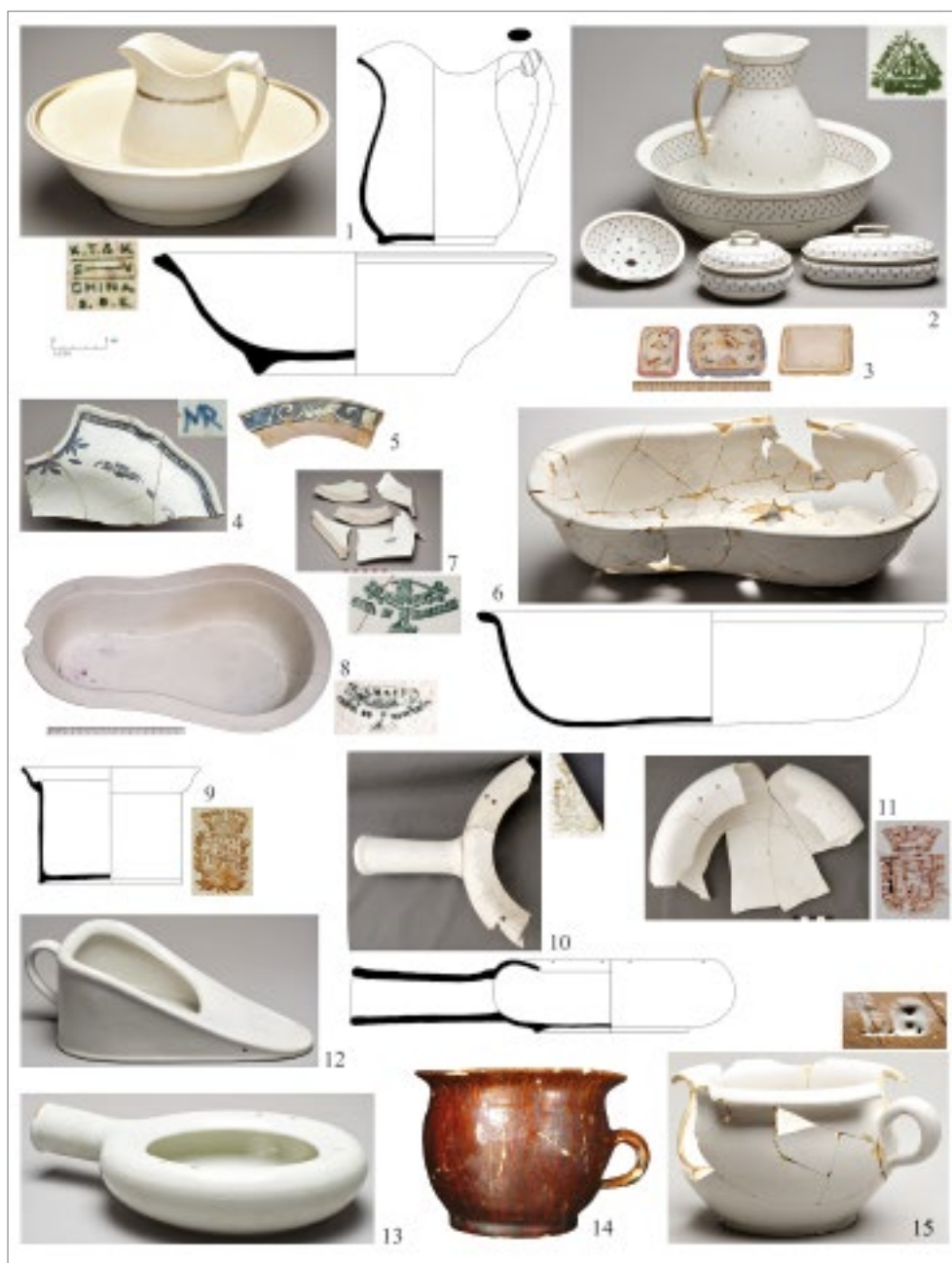
fig. 2 – n. 1, pot et cuvette en faïence fine, Amérique; n. 2, garniture de toilette, porcelaine de Limoges; n. 3, jouets en porcelaine; n. 4, plat à barbe en faïence, XVIII e s.; nn. 5-6, bidets en faïence XVIII e s.; nn. 7-8, bidets en faïence fine, Creil-Montereau; n. 9, crachoir en faïence fine, Bordeaux; nn. 10-11 bassins en faïence fine, Bordeaux et Gien; nn. 12-13 bassins en faïence; n. 14, vase de nuit vernissé vers 1700 (CASA-GRANDE 2010); n. 15, vase de nuit en faïence.

d'entre eux sont désormais confectionnés en faïence fine ou en porcelaine; leur volume se dilate aussi, ce qui est peut-être une indication des progrès très relatifs de l'hygiénisme, car on lave un peu plus de parties du corps. En 1830, Me Rivière, à Fort-Royal, possède ainsi à sa mort: «un pot et sa cuvette en porcelaine à filet d'or», d'origine probablement européenne 3 . En sus des brocs et cuvettes, les chambres cosuées offrent le confort de véritables services de toilette assortis, comprenant, outre les pièces de base, des boîtes à savon, à dentifrice, à brosses à dent, à éponge, des coquilles de bain (fig. 2, nn. 2-3). A la variété des matières correspond enfin un approvisionnement plus éclectique au XIX e siècle en tous cas. En dehors de la France et de l'Angleterre, les manufactures d'Europe centrale et les USA comptent dorénavant parmi les fournisseurs (fig. 2, n. 1). Si rien ne distingue les îles et la métropole