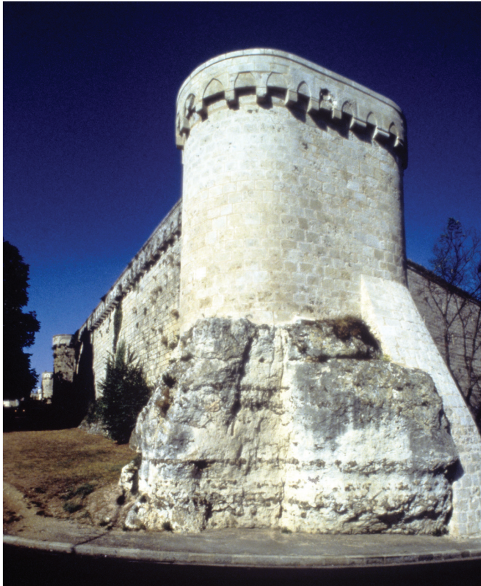
Fig. 2.— Détail de l'enceinte de Poitiers

plusieurs caractéristiques qui se retrouvent dans d'autres fortifications de leur domaine : tour-porte circulaire, tours de flanquement à éperon en amande et gaine de circulation ajoutée en fin de chantier 39 .