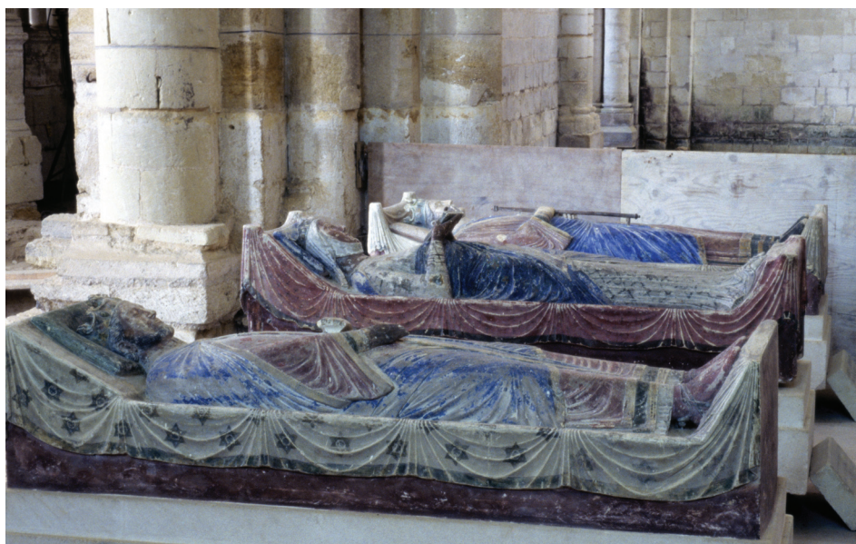
Fig. 5.— Gisants de Fontevraud