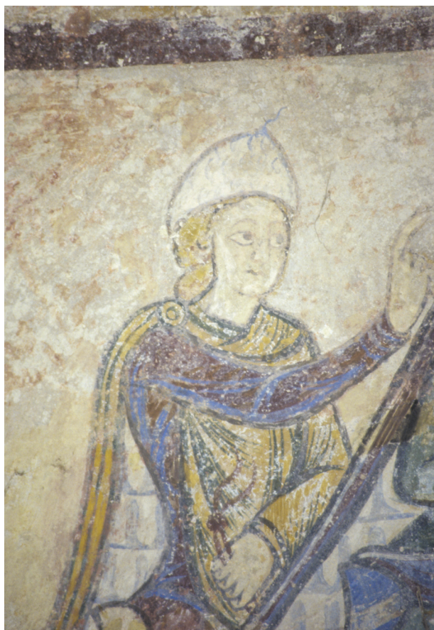
Fig. 13.— Jeune du cortège

lant le pileus de l'Antiquité (fig. 13). Cette coiffe triangulaire ainsi que le manteau doublé de vair et l'emplacement de sa