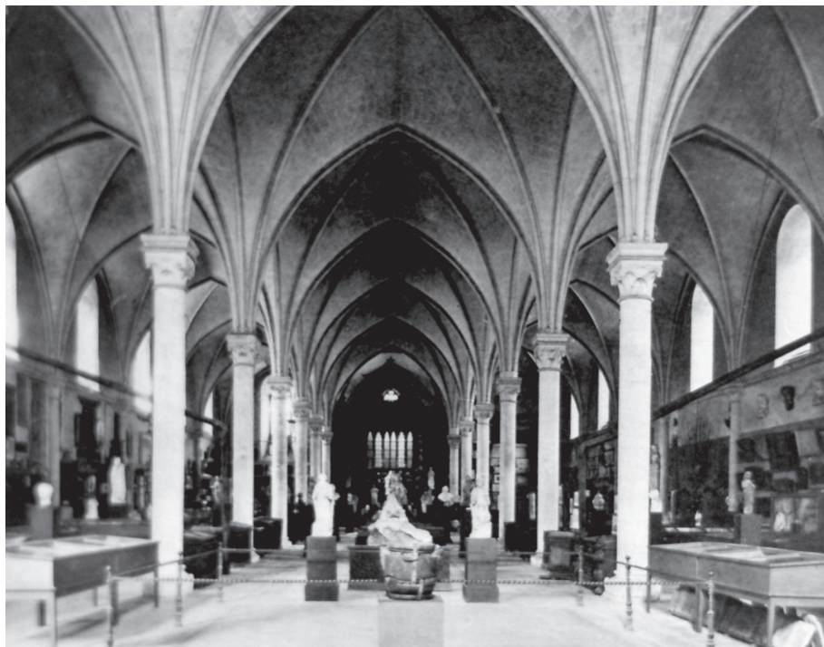
Fig. 3.— Hôpital de Saint-Jean d'Angers (Cl. CESC M Reproduction)