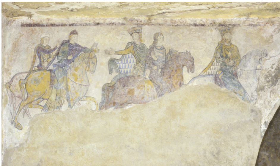
Fig. 12.— Peinture murale de Sainte-Radegonde de Chinon