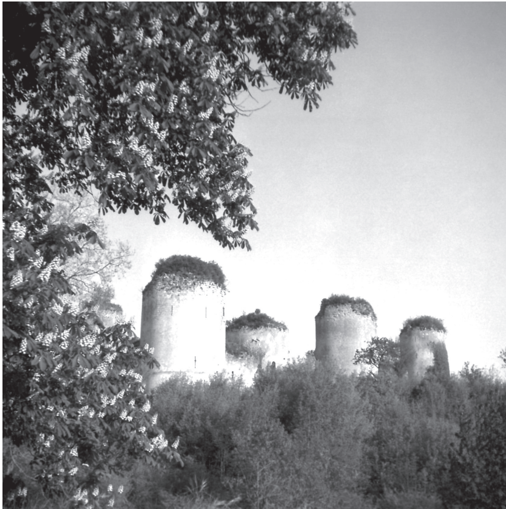
Fig. 1.— Château du Coudray-Salbart

enceintes avec leurs fossés. Ses bâtisses proclament, haut et fort, son pouvoir. Les fauteurs de troubles qui oseraient le défier seront vite écrasés. La justice qui règle les conflits ou la victoire qui met fin aux hostilités apporte la paix et, avec elle, les chantiers de bâtiments militaires censés la perpétuer. À l'image des tours et donjons, l'autorité princière est certes répressive, mais, incidemment, au détour d'une phrase de Robert de Torigni, une léproserie montre la sensibilité d'Henri II pour les malades et miséreux. Vis-à-vis de ses ennemis, toutefois, la crainte doit prévaloir sur l'estime qu'apportent l'assistance et la charité.