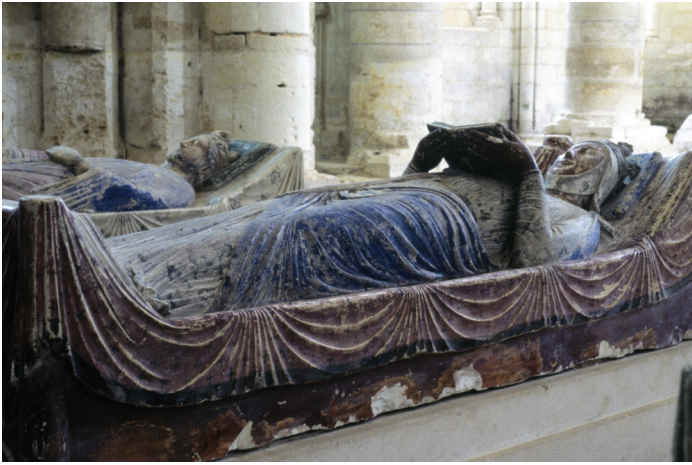
Fig. 8.— Aliénor d'Aquitaine