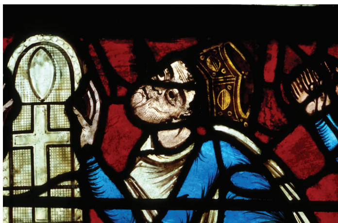
Fig. 11.— Henri II en donateur

évoquée, ainsi que son sacrifice au cours de la messe qui le rend réellement présent dans l'eucharistie 128 .