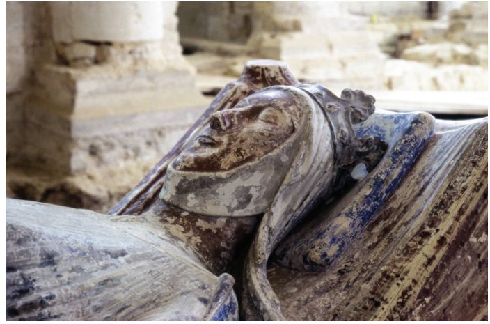
Fig. 9.— Tête d'Aliénor

A cinq kilomètres à peine de Fontevraud, sur la voie romaine qui mène à Chinon, Candes a dû être souvent visité par les Plantagenêt. C'est tout naturellement qu'en 1182, dans l'une de ses chansons relatant leurs luttes intestines, Bertrand de Born († c. 1215) leur associe ce village avec huit autres toponymes : le Cumberland, l'Irlande, Angers, Montsoreau (sur la Loire aussi, à deux kilomètres de Candes), Poitiers, Bordeaux, les Landes et Bazas, lieux de leur Empire qu'on devait tenir alors pour aussi célèbres 103 . La liste du troubadour limousin répond certes à l'assonance qui rehaussera la performance de son poème en musique. Elle n'en tient pas moins au prestige de Candes, alors en pleine croissance. Situé au confluent de la Loire et de la Vienne, le village profite du commerce fluvial de plus en plus animé. Il est, en outre, un important centre de pèlerinage, où saint Martin de Tours (†397) avait passé les dernières années de son existence et où il était mort. Une collégiale de chanoines assure son culte depuis la période carolingienne.