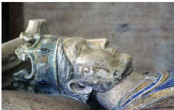
Fig. 6.— Tête couronnée d'un roi