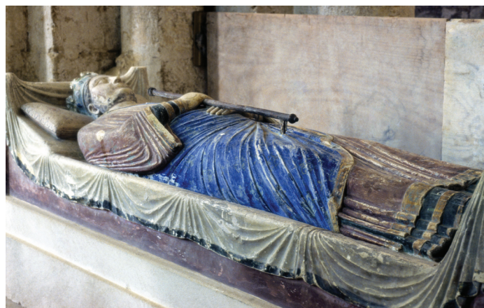
Fig. 7.— Le roi et ses regalia

La plupart des spécialistes accordent à Aliénor d'Aquitaine la commande des trois gisants polychromes en tuffeau, une pierre calcaire locale, qu'on peut contempler encore de nos jours dans la nef de l'abbatiale, tout près du chœur 95 , où ils ont dû se trouver jusqu'en 1504 96 (fig. 5). En fonction de l'histoire de la dynastie et de leur style, ils les datent d'environ 1200. En revanche, la statue plus petite en bois n'aurait pu être ajoutée aux trois autres qu'un demi-siècle plus tard. Elle représenterait Isabelle d'Angoulême (†1246), épouse de Jean Sans Terre et mère d'Henri III qui, en 1254, avait amené sa dépouille du cimetière des moniales au mausolée du chœur 97 . La dimension et le relief des trois sculptures des années 1200 représentent une innovation considérable dans l'art funéraire de la fin du XII e siècle, seulement précédée,