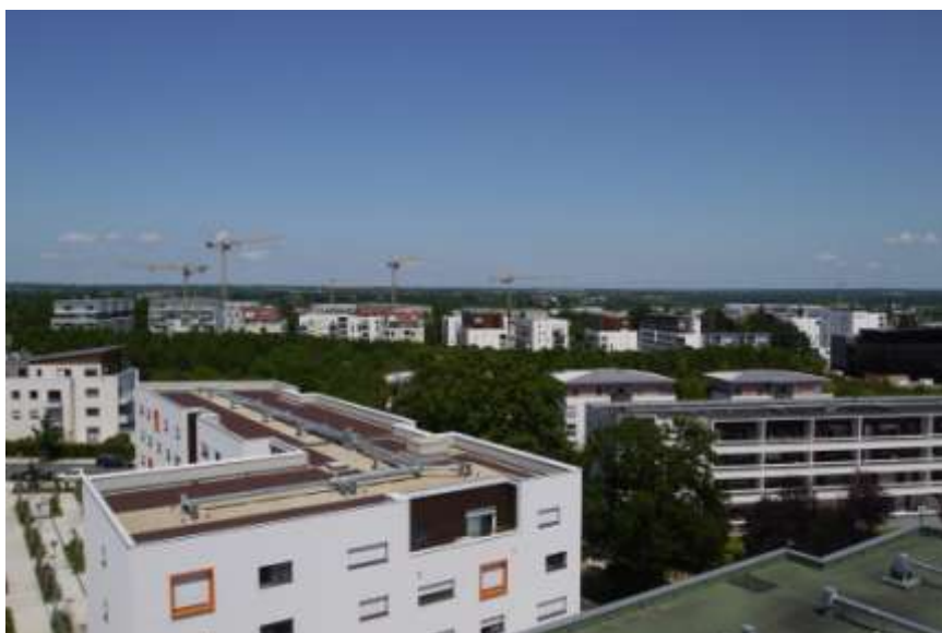
<Fig. 2 : Vue du quartier de Beaugard – F. Valegeas, 2012>

proximité sont intégrés au projet afin de « créer une vie de quartier et de renforcer la cohésion sociale » 13 .