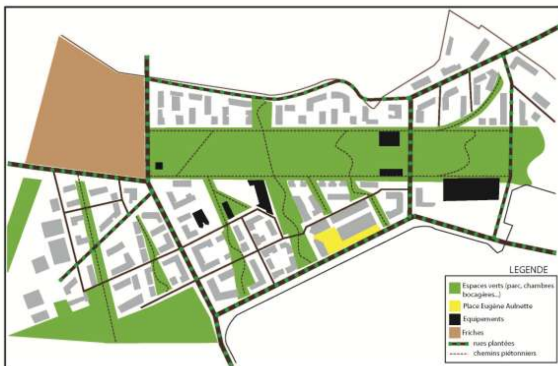
<Fig. 1 : Plan des espaces verts du quartier Beauregard – F. Valegeas, d’après Territoires et développement/Ville de Rennes, 2006>

D’autre part, le quartier de Beauregard, qui s’inscrit pleinement dans la stratégie de l’agglomération, cherche à promouvoir une mixité sociale par des programmes de logements diversifiés. Le Programme Local de l’Habitat a pour objectif d’ « offrir une gamme diversifiée de logements correspondant à la diversité des ménages » (PLH de Rennes, 2005). Les règles que l’agglomération s’est fixée sont ambitieuses : 25% de logements sociaux, 25% de logements intermédiaires et 50% de logements privés. Le projet de Beauregard cherche aussi à proposer une alternative de logement innovante pour de jeunes ménages avec enfants cherchant à accéder à la propriété, souvent contraints financièrement de se loger dans le périurbain. Sont alors mis en valeur la présence forte des espaces verts, mais aussi des formes urbaines et architecturales jugées attractives (comportant notamment des espaces extérieurs, réunis autour de jardins paysagers en cœur d’îlot).