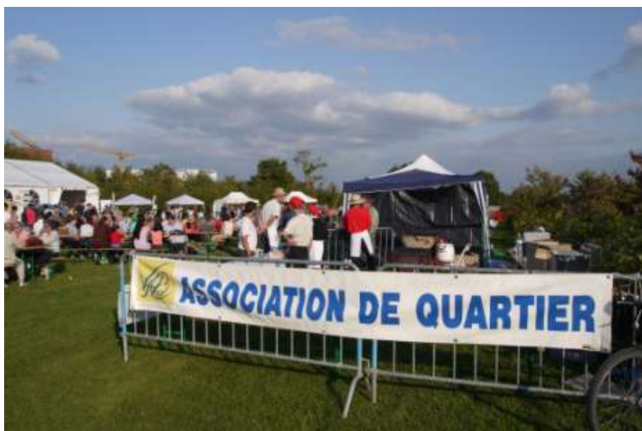
<Fig. 3 : « Vivre à Beauregard », organisateur de la fête annuelle de quartier>

Face aux difficultés rencontrées, un groupe constitué d'habitants « pionniers » a lancé une mobilisation autour de l'implantation d'une crèche dans le quartier, obtenue après quelques mois de négociation et finalement livrée en 2008 23 . Le rôle de ces « pionniers » mobilisés, une fois constitués en association, leur a permis d'acquérir une légitimité tant auprès des autres habitants du quartier que des acteurs locaux. Cette volonté de participer pleinement à la création du quartier fonde le projet de l'association d'habitants « Vivre à Beauregard » créée en 2008 : ses statuts insistent sur la volonté de « prendre part à l'aménagement du quartier » et à « encourager le lien social ». Elle comporte aujourd'hui plus de 250 adhérents, qui participent de manière très diverse aux activités proposées, qu'elles soient culturelles, sportives, ou davantage liées à l'enfance ou au devenir du quartier.