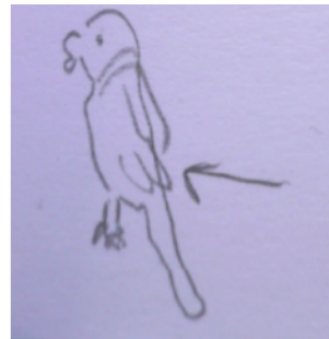
Figure 6.4. Un événement sonore à Wilhelmina Gasthuis Terrain-: le pic-vert qui pique les lanternes ! (illustrations issues de balluchons à Wilhelmina Gasthuis)