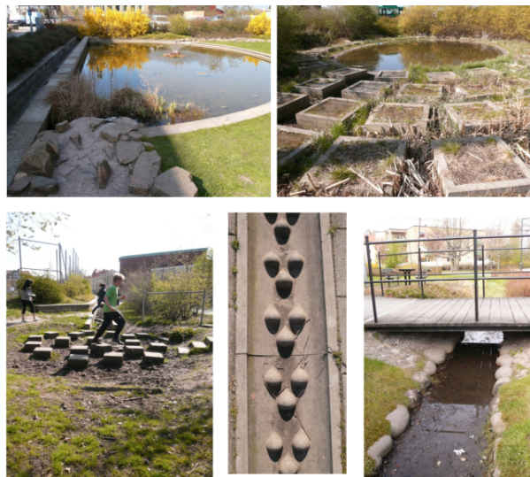
Figure 6.7. La place accordée à l'eau à Augustenborg (Faburel et al. , 2011 ; Manola, 2012).

Et pourtant, force est d'admettre, au contact de cas de quartiers durables analysés, que non seulement des ressentis multisensoriels existent, mais surtout que le paysage fait sens et que des marqueurs sont communs, quitte à standardiser quelque peu les percepts ( supra ). En fait, si « une écologie sensible s'impose (...) à côté de paramètres plus abstraits (consommations d'énergie, d'eau, émissions de CO 2 , etc.). Elle s'affirme de manière presque incidente, souvent dans le sillage d'exigences techniques : la gestion des eaux pluviales à ciel ouvert, en particulier, perméabilise les sols et métamorphose les paysages. » (Emelianoff, 2007, p. 23), Cela est fort bien illustré à Augustenborg (figure 6.7) mais aussi dans les autres quartiers où le traitement des eaux de pluie en surface influe grandement sur les perceptions sensorielles.