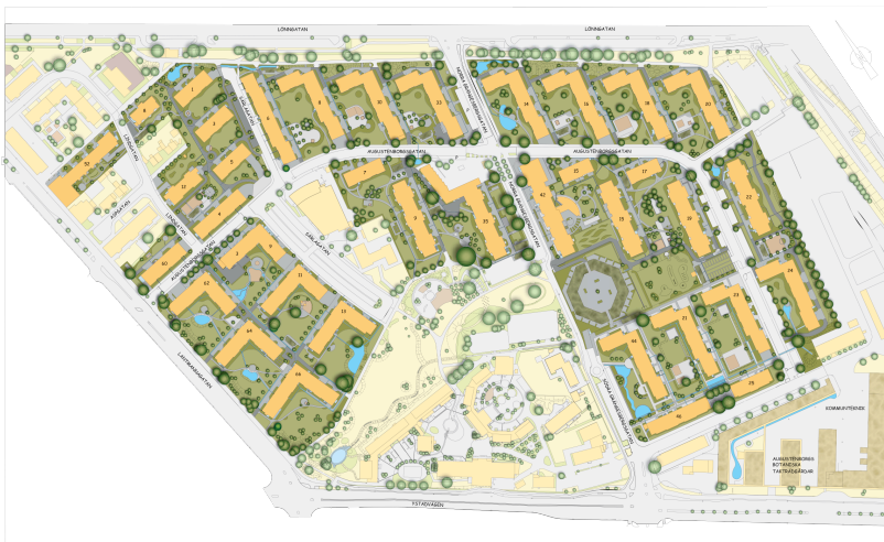
Figure 6.1. Plan d'Augustenborg à Malmö.

Un des premiers groupes de résultats de notre travail est tiré de l'analyse des qualificatifs utilisés, des objets et activités reliés pour exprimer les paysages et le sensible. Selon l'analyse du corpus recueilli 1 , le paysage renvoie avant tout à une matérialité palpable de l'espace vécu. Loin de la seule architecture locale, il a ici souvent un caractère naturel (re)marqué, surtout représenté par la verdure mais aussi par la présence de l'eau et d'animaux. Le rôle du grand paysage est également prégnant dans les qualifications données, et sous-tend alors l'existence d'espaces ouverts plus ou moins aménagés (prairie, littoral, colline...), propres à plusieurs des cas d'étude (figure 6.1).