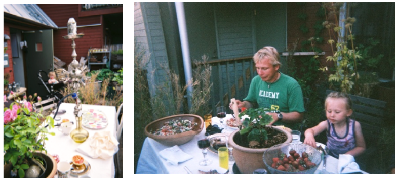
Figure 6.2. Family breakfast et Sunday lunch with friends (Faburel et al., 2011, illustrations issues d'un balluchon à Bo01).

Ces rapports sensoriels exprimés par les ressentis paysagers sont donc aussi bien distanciés qu'immersifs, aussi bien contemplatifs que plus participatifs, rompant avec l'acception classique du paysage. Et, par cette diversité des rapports de « l'homme dans le paysage » (Corbin, 2001), effectivement les échelles de temps s'entremêlent (passé, mais surtout présent et futur, nous y reviendrons), par le biais de la qualification naturelle mais aussi urbaine du paysage. De même, les espaces renvoient aussi bien à des constructions individuelles que collectives, allant du jardin « en bas de chez-soi » au grand paysage, ouvert, et parfois aussi remarquable. Ainsi, il apparaît que, dans les cas d'écoquartiers étudiés, les paysages, en tant que systèmes de relation(s) de(s) l'homme avec le(s) territoire(s) et leur(s) lieu(x) de vie, sont bien des