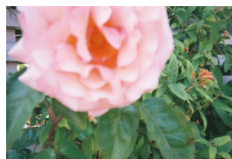
Figure 6.5. Fleurs et assemblages de fleurs (illustrations issues de balluchons à Wilhelmina Gasthuis Terrain, Augustenborg et Bo01)

Ce faisant, par-delà la confirmation du rôle des objets de nature dans les relations paysagères tissées, ce sont principalement les caractéristiques visuelles (urbaines, architecturales ou artistiques) qui distinguent à ce jour sensoriellement ces quartiers. Et, si certains traits sensoriels non visuels les singularisent malgré tout parfois, ils sont