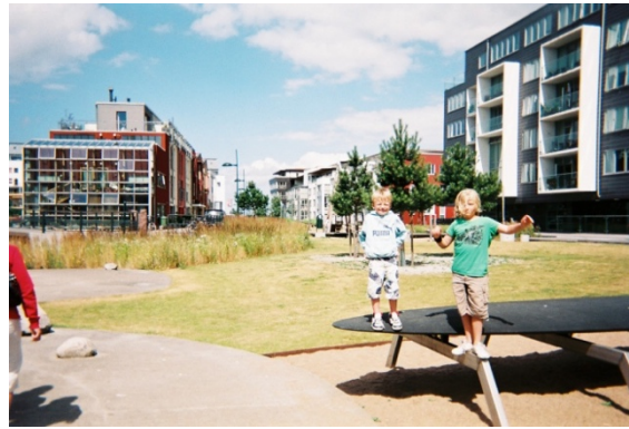
Figure 6.3. Sons et jeux d'enfants (illustrations issues de balluchons à Wilhelmina Gasthuis Terrain et Bo01)