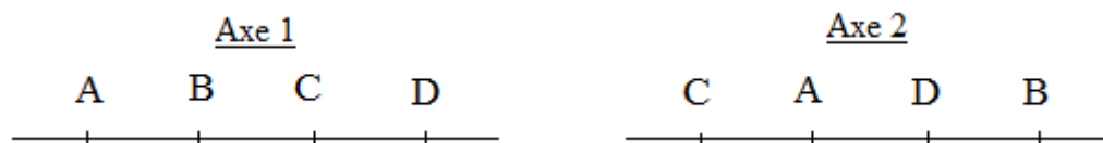
Graphique 1 : Deux exemples de classement des candidats A, B, C et D

En revanche, le deuxième axe proposé, \{C - A - D - B\} , est parfaitement cohérent avec les choix des électeurs, puisque, quel que soit le bulletin considéré, aucun candidat non approuvé ne vient jamais s'interposer entre deux candidats approuvés. Dans notre exemple, cet axe traduit donc de façon satisfaisante la vision des proximités politiques qui est celle des électeurs eux-mêmes, puisque les trois bulletins proposés sont strictement unimodaux sur cet axe. Il en serait évidemment de même de l'axe exactement symétrique \{B - D - A - C\} qui lui est équivalent.