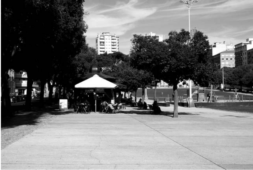
Figure 3 : L'Alameda Dom Afonso Henriques à Lisbonne : un kiosque (les tables dédiées aux jeux de cartes sont derrière), une terrasse, une aire de jeux pour enfants, une pelouse et des bancs.