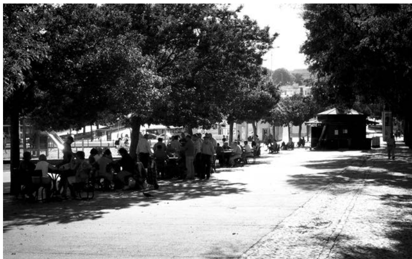
Figure 2 : L'Alameda Dom Afonso Henriques à Lisbonne : un kiosque (la terrasse est derrière), une aire de jeux pour enfants, une pelouse, des bancs et des tables dédiées aux jeux de cartes. (source : auteur, août 2012)